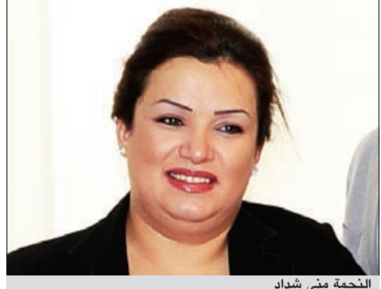
النجمة مني شداد

الفنانة مني شداد تنقلنا الى العالم الجميل من التراث الكويتي بديكوره المميز عبر قناة فنون في رمضان. شداد تستضيف في كل حلقة نجوم الفن والإعلام ويتم الحديث عن الموروث الكويتي بكل ما يحمله من أصالة ونكريات.