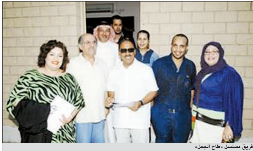
فريق مسلسل «طاح الجمل»