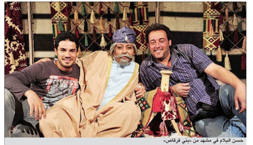
حسن البلام في مشهد من «بني قرقاص»