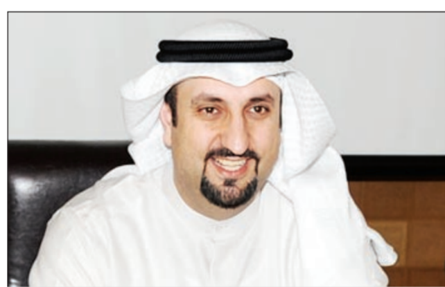
نائب رئيس الشركة الوطنية للإعلام طريف العوضي