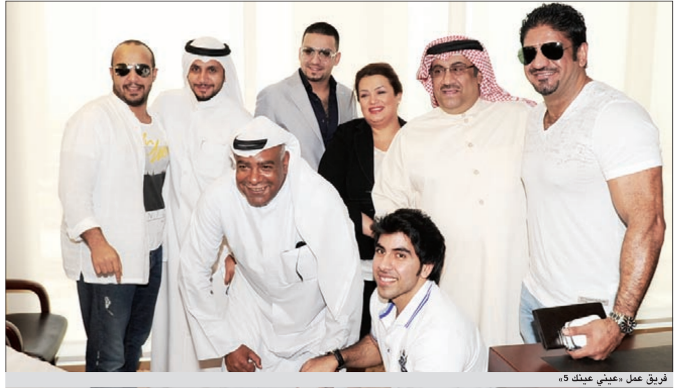
فريق عمل «عيني عينك 5»

الدورة تتضمن برامج ومسلسلات إنتاجها قديم!