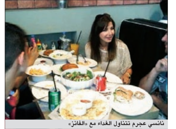
نانسي عجرم تتناول الغداء مع «الفانز»

كعادتها تحرص النجمة اللبنانية نانسي عجرم على مقابلة «الفانز» الخاص بها، ولكن اللقاء الذي عقده