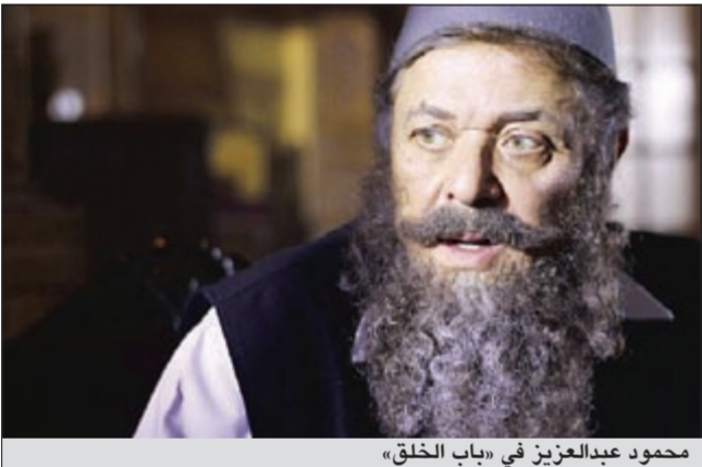
محمود عبدالعزيز في «باب الخلق»

محمد سليمان عبد الملك، على مدار عدة أشهر قبل الشروع في تصويره، حيث حرص فريسي العمل على مراجعة كافة التفاصيل الدقيقة، كما استغرق المخرج عادل أديب بعض الوقت في اختيار اللوحه الجديدة التي تشارك في بطولة المسلسل من بين مئات الشباب الذين تقدموا له.