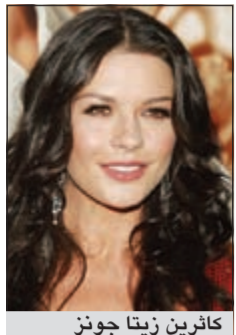
كأثرين زيتا جونز

وكالات: صرحت كأثرين زيتا جونز أخيرا بأنها شاهدت زوجها مايكل دوغلاس يرتدي مجهراتها وملابسها الداخلية وذلك سعيًا منه للتخضير لتجسيد شخصية لاعب بياينو مثلي الجنس في فيلم Behind The Candelabra لكن النجمة الجميلة تراجعت خلال مقابلة تلفزيونية لها عن تصريحها هذا حيث قالت: كنت أمزح حول ما قلته سابقا عن أن مايكل يرتدي ملابسها الداخلية، الأمر غير صحيح البتة ولا أريد في أن تبدأ الصحافة الآن بالكتابرة عن هذا الموضوع وتحليله.