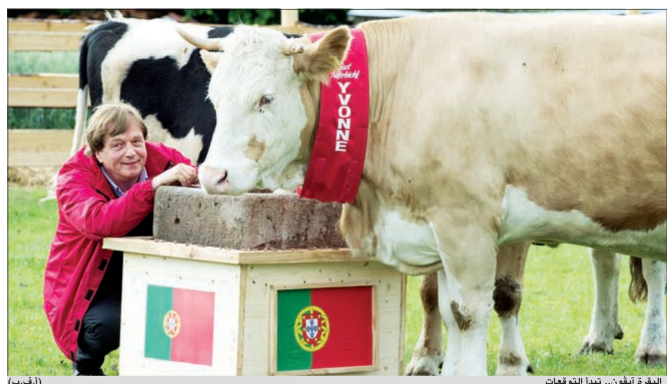
البقرة آيفون.. تبدأ التوقعات

بعد نجاح الأخطبوط بول في التوقع على نحو دقيق بنتائج مباريات كأس العالم لكرة القدم في جنوب أفريقيا عام 2010 يتم التنافس حالياً بين خنزير وبقرة وفيل على توقع نتائج مباريات بطولة كأس الأمم الأوروبية. بعد أن وقع اختيار بلدية العاصمة الأوكرانية كييف على خنزير يتمتع بذكاء حاد وقدرة على التوقع مثل الأخطبوط بول الذي لم تخب توقعاته قط في «موندريال 2010»، اختارت بولندا فيلًا وألمانيا بقرة للقيام بالمهمة ذاتها. وعلى عكس التوقعات الدقيقة للأخطبوط بول الذي نفق في عام 2010 خاب توقع الخنزير الأوكراني المدعو «فونتك» في مباراة الافتتاح التي توقع فيها فوز بولندا على اليونان وخرج الفريقان متعادلين، إلا أنها أصابت في المرة الثانية بتوقعه فوز روسيا على جمهورية التشيك.