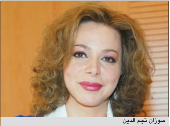
سوزان نجم الدين

نجحت الفنانة سوزان نجم الدين في اللحاق بالدراما المصرية هذا العام بعدما انضمت إلى مسلسل «باب الخلق» الذي يؤدي بطولته محمود عبدالعزيز. وتستعد الممثلة السورية حالياً للسفر إلى لندن، إذ تدور مشاهدتها بالكامل في بريطانيا وأوكرانيا. وتجسد سوزان، بحسب موقع «أنا زهرة»، شخصية فتاة مصرية ذات جذور سورية تتعرف إلى محمود عبدالعزيز، وتكون من الشخصيات المؤثرة في حياته، وكانت نجم الدين تستعد لخوض تجربة جديدة في الدراما المصرية، لكن تأجل تصوير مسلسل «فتاة من الشرق» الذي كان يفترض أن