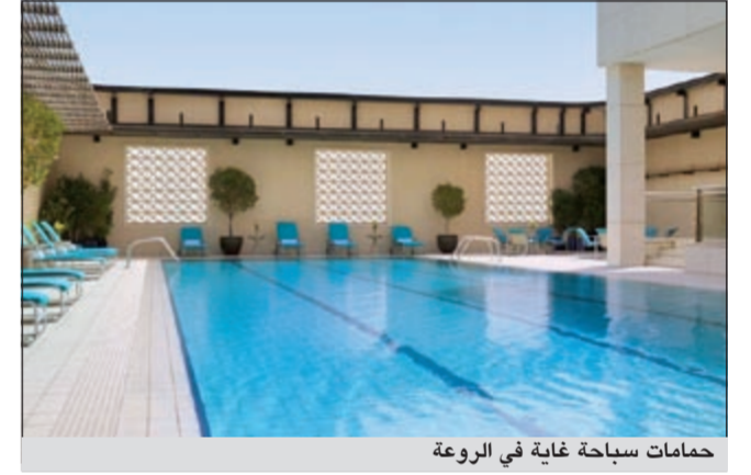
حمامات سباحة غاية في الروعة

هذا وتتراوح اسعار الغرف ما بين 39 و45 ديناراً لليلة الواحدة بالإضافة الى 15٪ بديل خدمة، ووفقاً لباقية الصيف سيحصل الضيوف الذين يصاحبهم أطفال من 6-12 عاماً على خصم 50٪ على جميع وجباتهم في المطاعم، والتي جانب خدمة الانترنت فائقة السرعة المتوافرة مجاناً في جميع غرف الضيوف وفي أنحاء الفندق، سيتمكن الضيوف أيضاً من الدخول مجاناً الى النادي الصحي والي حمام السباحة. ويمكن للضيوف في فندق كورت يارد ماريوت زيارة مطعم «سول اند سبايس» الهندي الشهير، والذي يقدم مزيجاً مثالياً