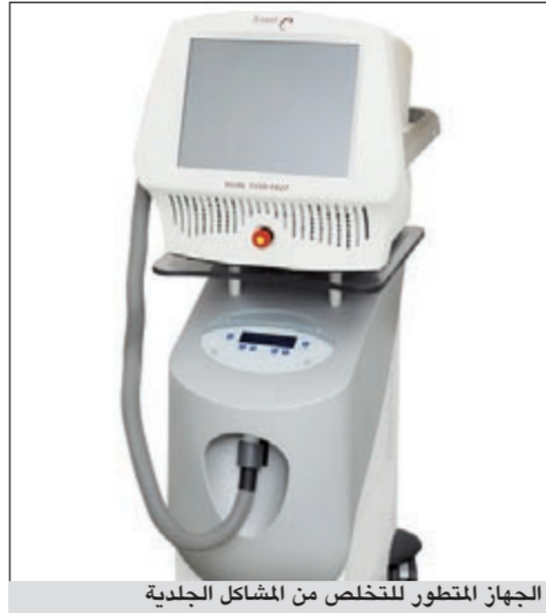
الجهاز المتطور للتخلص من المشاكل الجلدية