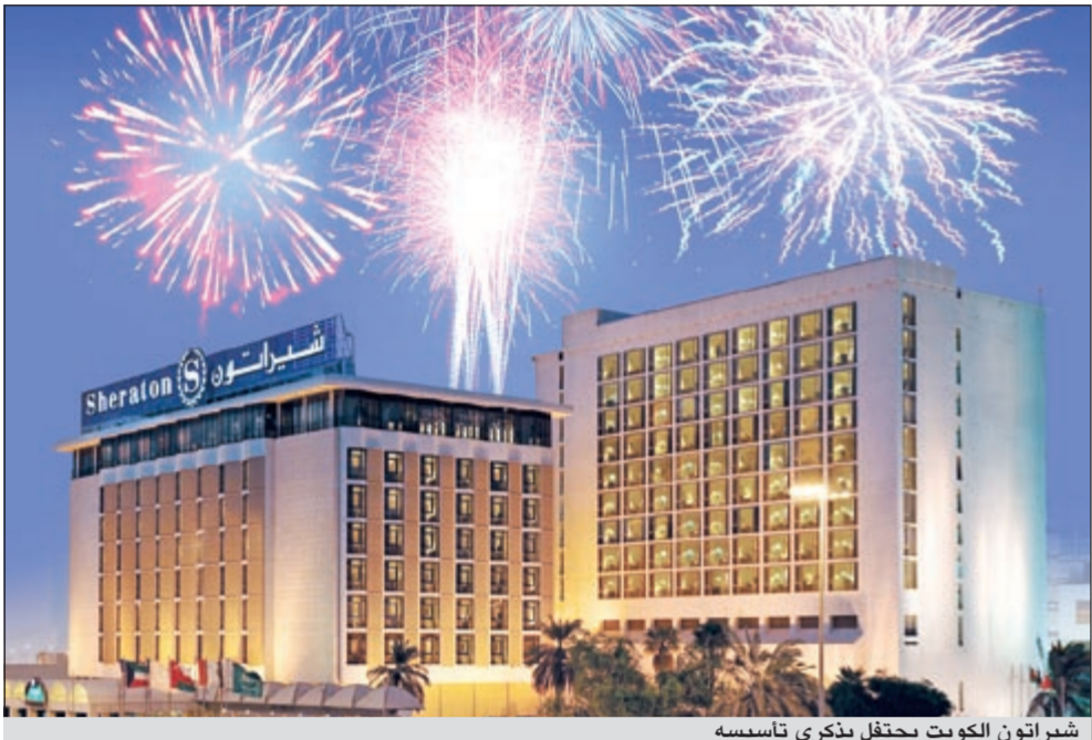
شيراتون الكويت يحتفل بذكرى تأسيسه

الى افتتاح فروع جديدة لكل من مطاعم الطربوش، بخارى، شهريار والحمراء، وذلك في التوسعة الجديدة لمجمع الأقيانوس والمنظر افتتاحها في سبتمبر المقبل.