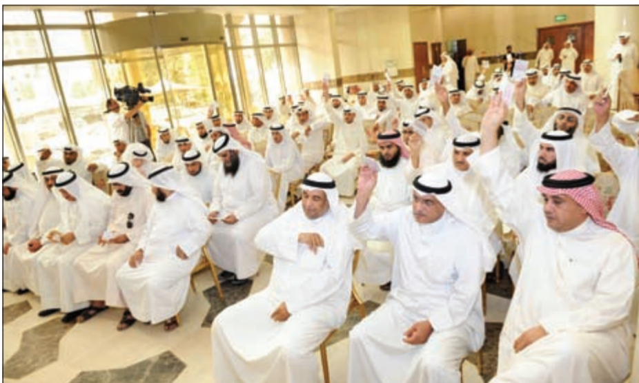
حضور حاشد خلال التصويت من قبل الجمعيات التعاونية

وبهذه المناسبة ادلى رئيس الإتحاد عبدالعزيز السمحان بتصريح للصحافيين اعراب فيه عن سعادته للمشاركة في عرس انتخابي لاتحاد اتحاد الجمعيات التعاونية بعد غياب دام اربع سنوات في ظل الإتحاد المعين من قبل وزارة الشؤون الاجتماعية والعمل مؤكداً ان جميع الفائزين في الانتخابات كلهم حماس وثقة