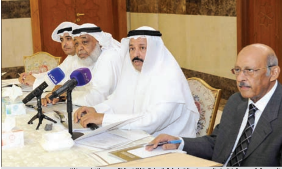
الجمعية العمومية لاتحاد الجمعيات التعاونية السابق تناقش التقريرين الإداري والمالي

أسفرت انتخابات اتحاد الجمعيات عن فوز كاسح لكتلة التعاون التي استطاعت الحصول على المناصب القيادية بتصويت 31 تعاونية لصالحها، الأمر الذي أنهى الكهنتات التي دارت خلال الأيام الماضية حول مصير الإتحاد، والجهة التي سوف ترأس المرحلة المقبلة، وتقوم بعملية التطوير والبناء والتصحيح وإعادة الهيكلة للكيان التعاوني.