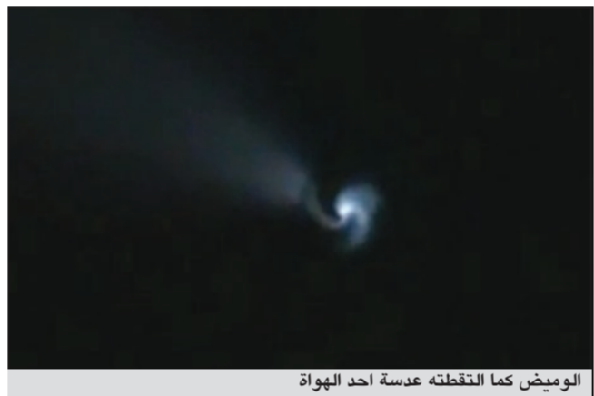
الوميض كما التقطته عدسة احد الهواة

ستتجه إليه أنظار علماء الفلك بالتحليل والتحخيص من جميع علماء الأرض. وأوضح الزعاق أن الفارق بين النيزك الحجري والمعدني يتم عن طريق المشاهدة والمشاهدة تنحصر في الشعاع والدخان، فإذا كان اللهب على خط مستقيم ومتلون ودخان قليل فهذا نيزك معدني وإذا كان اللهب خاطفاً وبقي دخانه عالقاً فهذا نيزك حجري فالشهاب أو النيزك هو شريط أو خط ضوئي متوهج وخافت يشاهده الراصد في سماء الليل نتيجة لدخول جرم صغير أو قطعة غبار إلى الغلاف الجوي الأرضي.