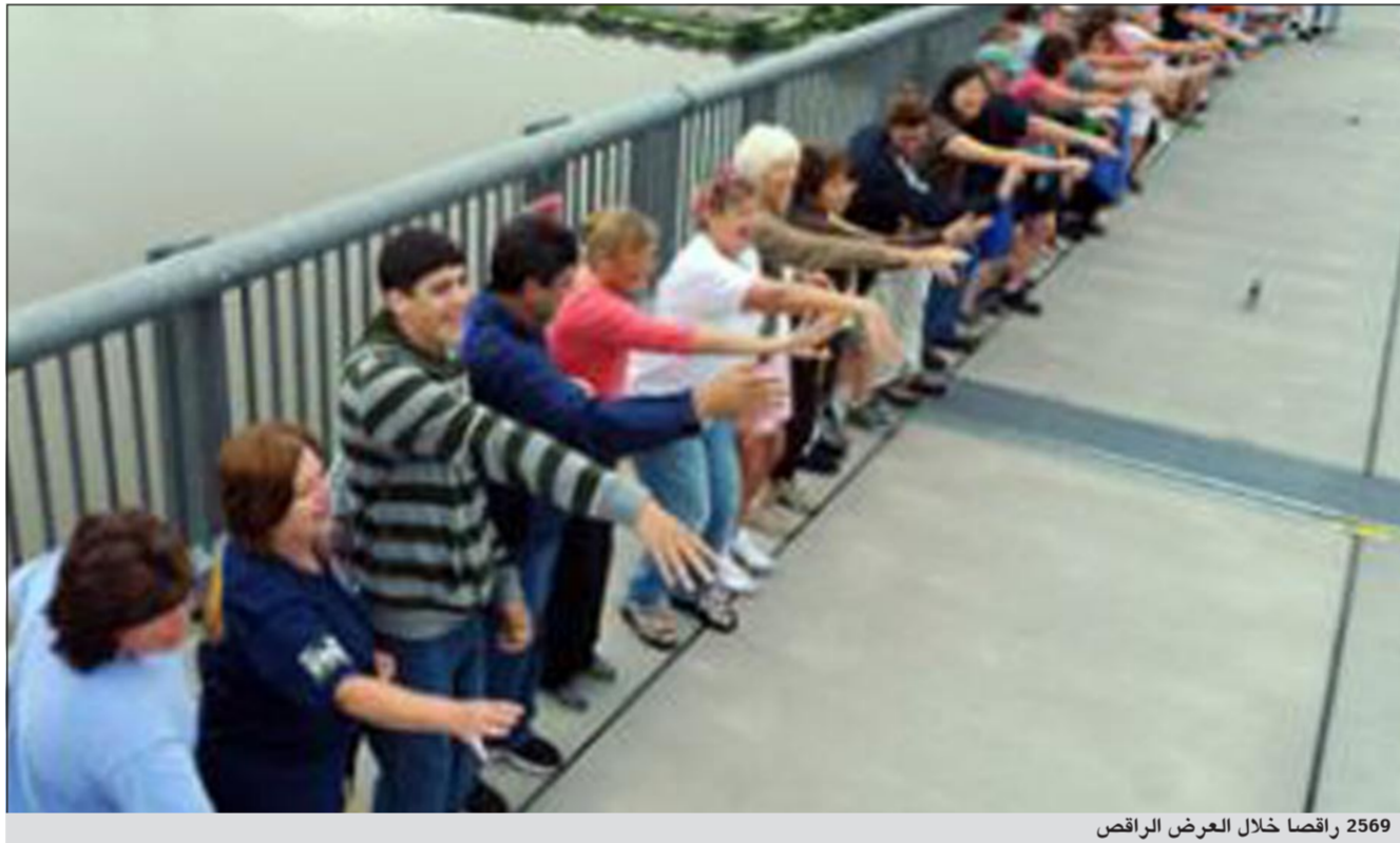
2569 راقصا خلال العرض الراقص

نيويورك. فصف الراقصين دار حول النهر مؤديا رقصة الهوكي بوكي على أطول جسر في العالم مخصص للمشاة فوق نهر «هادسون» بمدينة نيويورك.