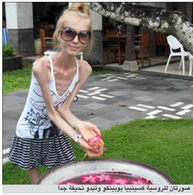
صورتان للروسية كسينيا بوبينكو وتبدو نحيفة جدا