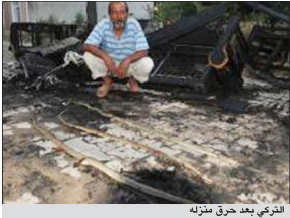
التركي بعد حرق منزله

اسطنبول - وكالات: أقدم تركي على إحراق منزله بعدما تبين له أنه أصبح وكرا لثعابين ضخمة حيث تمكن من قتل 3 منها بمساعدة الجيران وطاقم من البلدية.