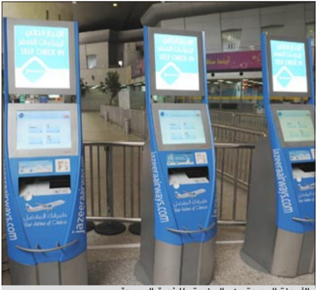
الأجهزة الجديدة من «الجزيرة» للخدمة السريعة