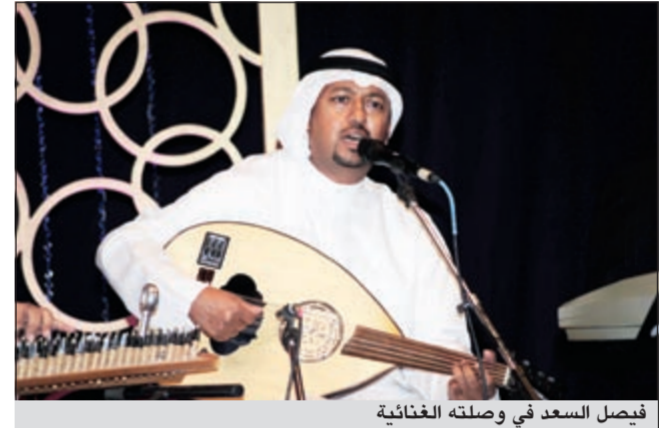
فيصل السعد في وصلته الغنائية

في الحفل القبيل النهائي لمهرجان الموسيقى الدولي الخامس عشر احيا الفنان الشعبي فيصل السعد أمسية موسيقية رائعة قدم فيها مجموعة من الأغاني الكويتية التراثية بجميع أشكالها. وأمتع فيصل السعد الحضور بـ 10 اغان متميزة وكانت البداية مع «يا من يسلملي» واتبعها بأغنية «يا هلي»، ثم شدا بد «البوشية» وتالها بأغنية «الله هاليوم» وسط تفاعل كبير من الحضور، ثم قدم اغنية «أبو قذيلة» و«الله أكبر يا حمام» واتبعها بـ «الله يالهوى» و«أبو عيون فتانة»