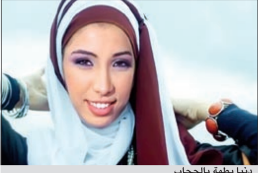
دنيا بطمة بالحجاب

وصغيرة في عيني الحمد لله» وطلبت رأي معجبيها في الصورة، وبالفعل تفاعل معها محبوبا وأثنوا على صورتها بالحجاب.