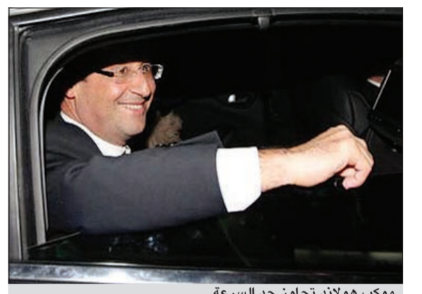
موكب هولاند يتجاوز حد السرعة

باريس - د.ب.أ: تعرض الرئيس الفرنسي فرنسوا هولاند بعد شهر من توليه المنصب متعهدا بأن ينتهج سلوكا يحثذى لموقف صعب الخميس بعدما سجل فريق اخباري سير موكبه بسرعة ضعف الحد المسموح به.