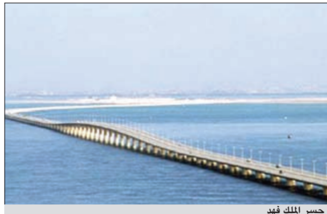
جسر الملك فهد

وتعود فكرة إنشاء الجسر إلى عام 1965، عندما استقبل العامل السعودي الراحل الملك فيصل بن عبدالعزيز العامل البحريني الشيخ خليفة بن سلمان خلال زيارة للمنطقة الشرقية السعودية، وقد أبدى آل خليفة رغبته في بناء جسر يربط السعودية بالبحرين، الأمر الذي وافق عليه الملك فيصل وأمر بتشكيل لجنة مشتركة بين البلدين لدراسة إمكانية تنفيذ مشروع جسر يربط بين البلدين. وقد بدأ العمل الرسمي في بناء الجسر في 29 سبتمبر عام 1981، وتم تخيبت أول قاعدة من قواعد الجسور في يوم الأحد 27 فبراير 1982، بينما تم افتتاح الجسر يوم الأربعاء 1986/11/26 بحضور العامل السعودي الراحل الملك فهد بن عبدالعزيز والعامل البحريني الراحل الشيخ عيسى بن سلمان آل خليفة.