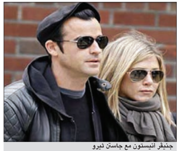
جنيفر أنيستون مع جاستن ثيرو

لوس انجليس - يو.بي.أي: تشارك النجمة الأميركية جنيفر أنيستون في فيلم قصير إلى جانب حبيبها الممثل جاستن ثيرو يتناول تغطية وسائل الإعلام لحياتهما معا.