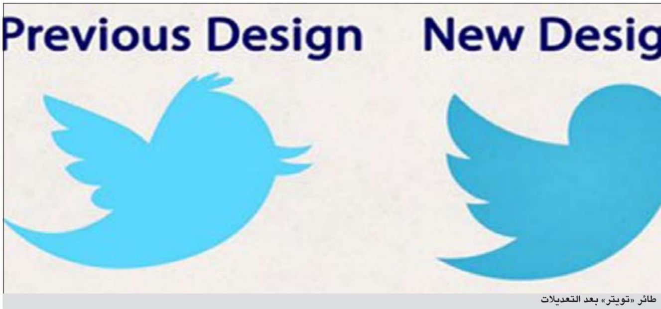
طائر «تويتر» بعد التعديلات

الشهير في استخدامه كعلامة تجارية حفرت في أذهان المدونين حول العالم لتربطهم بعالمهم المليء بالتغريدات وبرز على التغيير عالمياً، كشف عنها فيديو جديد أطلقته الشركة عبر قنواتها الرسمية على يوتيوب ليبقى السؤال: هل لاحظ أي من عشاق الموقع هذا التغيير؟ الطائر الأزرق الجميل الذي اشتهر به تويتر يعتبر هذا التعديل هو الثالث له منذ أن بدأ الموقع