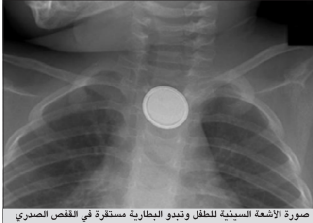
صورة الأشعة السينية للطفل وتبدو البطارية مستقرة في القفص الصدري