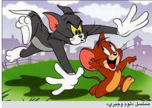
مسلسل «توم وجيري»