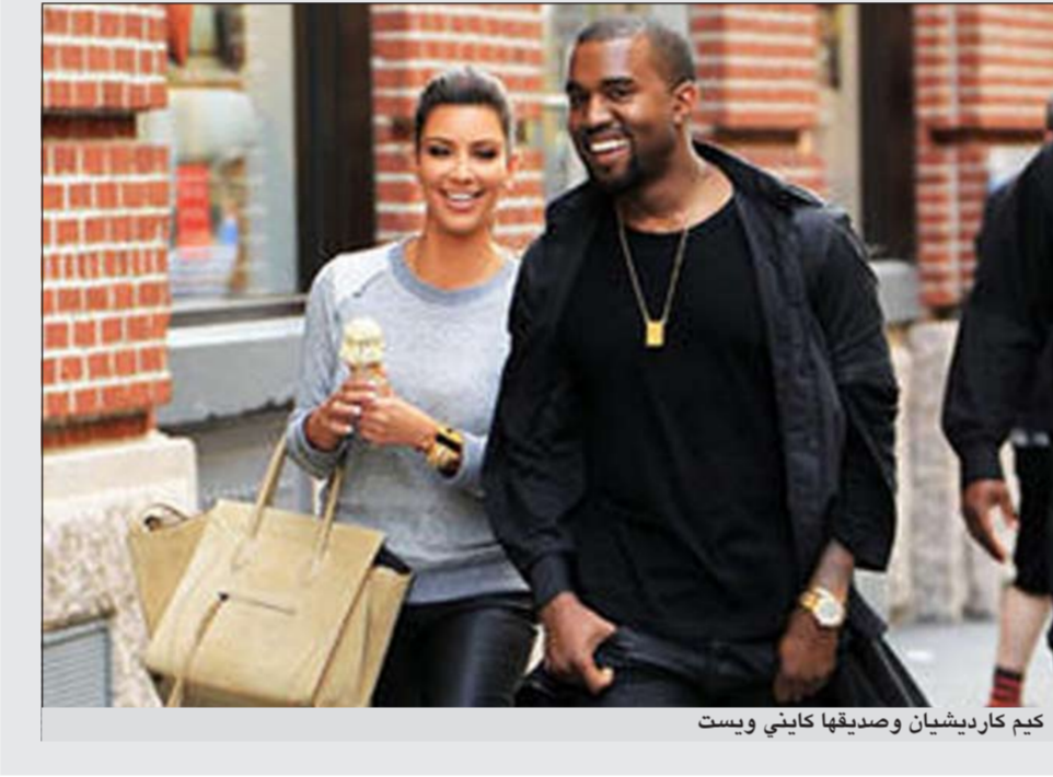
كيم كارديشيان وصديقتها كاييني ويست

ليست هدية عادية تلك التي قدمتها نجمة تلفزيون الواقع الأميركية كيم كارديشيان لصديقها النجم الموسيقي كاييني ويست في عيد ميلاده، لأنها عبارة عن سيارة لمبرغيني بقيمة 750 ألف دولار. والمفارقة أن علاقة كارديشيان ويوست لم يمر عليها أكثر من 3 أشهر وهي تلت زواجها الذي استمر 72 يوماً فقط بلاعب كرة السلة كريس همفريز. وقال مصدر لمجلة «يو أس ويكلي» أن كارديشيان (31 عاماً) أهدت صديقها في عيد ميلاده 35 سيارة لمبرغيني من نوع «افانتادور ال بي 700»، يبلغ ثمنها 750 ألف دولار. ولكن ويست لن يتمكن فوراً من اختيار سيارته الجديدة لتواجده في أيرلندا في جولة فنية.