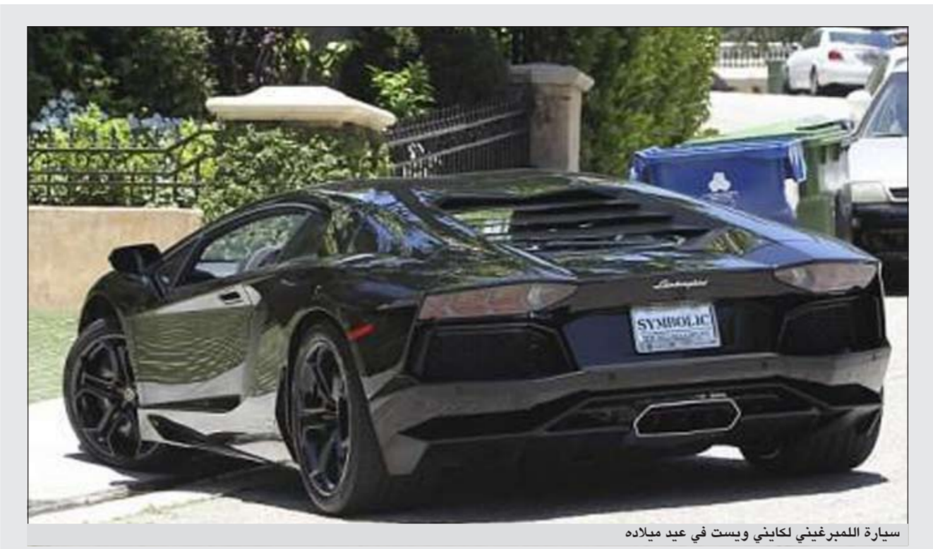
سيارة المبرغيني كاييني ويست في عيد ميلاده

وتكتظ شوارع بكين وطرقها بصفوف من السيارات، وتم تسجيل 700 ألف سيارة جديدة في عام 2010 وحده، ما دفع سلطات بكين إلى فرض قيود على تسجيل أي سيارات جديدة. وتم قصر أعداد السيارات الجديدة في العام الماضي على 240 ألف سيارة فقط، ومنذ ذلك الحين توزع 20 ألف لوحة سيارة جديدة من خلال إجراء سحب (قرعة) كل شهر.