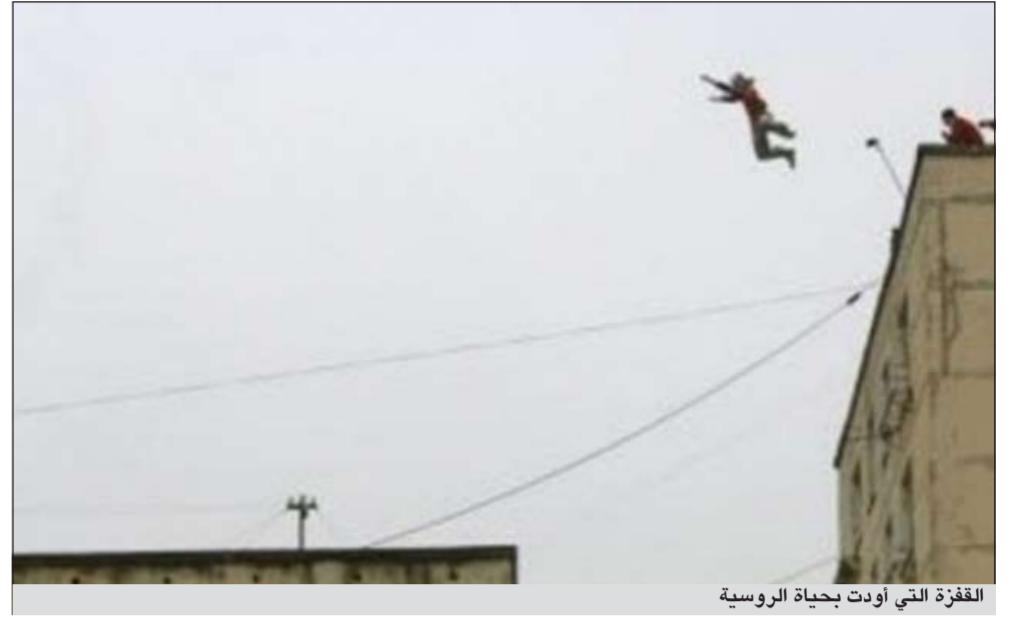
القفزة التي أودت بحياة الروسية

موسكو - وكالات: نظرت أمامها مباشرة في اتجاه سطح البناية المقابلة التي انخفضت عن مستوى نظرها مسافة عدة أمتار، ابتسمت في اتجاه العدسات التي ركزها المصورون عليها في انتظار قفزتها الأولى، بعد أن قررت ممارسة رياضة القفز النقطتها العنسات هي صورها الأخيرة بعد أن أخذت تقدير المسافة بين البنايتين فهوت سرعا من أعلى 17 طابقا، لتنتهي حياتها أثناء درسها الأولى وسط ذهول الحاضرين وصرخات أختها الكبرى التي شهدت الحادثة المأساوية التي أثارت ضجة كبيرة في «بيتسبرج» بروسيا.