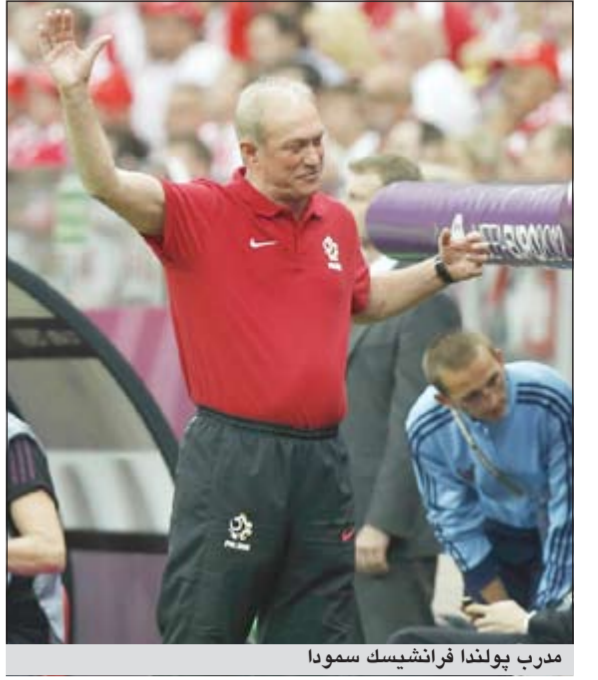
مدرّب يولندا فرانثيسك سمودا

اعتبر مدرب يولندا فرانثيسك سمودا ان تعادل منتخب بلاده مع اليونان ليس نهاية العالم، وقال سمودا في المؤتمر الصحافي «المباراة الافتتاحية في بطولة كبرى دائما ما تنتهي بالتعادل، لكن النتيجة ليست نهاية العالم بالنسبة اليانا»، وأضاف «بالطبع، كنا نتطلع الى الفوز لكننا لم نتمكن من تحقيق ذلك، كان لاعبو فريقنا تحت ضغوطات كبيرة، وتتبقى لنا مباراتان ويتعين علينا ان نلحق بفريقنا، قبل ان نلعب في مباراتنا المقبلة ضد روسيا في ال12 الحالي، قبل ان نتختم مشوارنا في دور المجموعات ببقاء التشيك في ال16 منه، وأعرب سمودا عن تمسكه بالتفاؤل، وقال سمودا إن بعض لاعبيه ربما شعروا بالضغط التي تخوض عليها المباريات الافتتاحية والتوقعات الزائدة من قبل الجماهير إضافة إلى أنها المباراة الرسمية الأولى للفريق منذ ثلاث سنوات، وأوضح «وقعنا تحت ضغوط رهيبه، واعتقد ان المباراة حملت عبئا كبيرا على هذا الفريق الشاب، لم يشارك هذا الفريق الشاب في بطولات من قبل على عكس الفريق اليوناني، نحن ما زلنا في البداية ولكننا اعتقد اننا سنحقق أهدافنا بعبور هذه المجموعة»، وقال سمودا إنه لا يرغب في التعليق على البطاقة الحمراء التي أشهرا الحكم في وجه حارس المرعى.