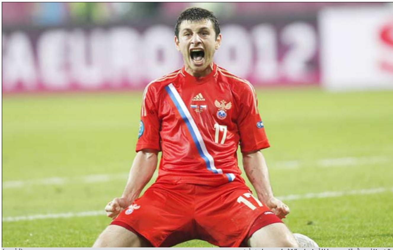
المدرب داغوييف قاد روسيا للفوز على التشيك وسجل هدفين

وجه جيرارد بيكيه لاعب المنتخب الإسباني لكرة القدم رسالة «تفاؤل» إلى بلاده التي تواجه أزمة اقتصادية كبيرة في الوقت الحالي، قائلا: «إننا لن نحقق»، ويستعد بيكيه في مدينة جنيفينو البولندية لمواجهة إيطاليا اليوم، وسط استعدادات المنتخب، تلقى اللاعبون أنباء الأزمة المالية التي تواجهها إسبانيا واعتزموا التقدم بطلب لصندوق إنقاذ منطقة اليورو «صندوق تسهيل الاستقرار المالي الأوروبي» لمساعدتها في إعادة رسملة بنوكها المتعثرة. وحاول بيكيه مؤازرة المواطنين في إسبانيا قائلا: «نحن نعرف مدى صعوبة الموقف، ولكنني أريد ان نتمسكوا بالثقة، إننا لن نحقق»، وقال زميله فرناندو تورريينتي: «إن تجاوز الأوقات العصيبة يعد أمرا رائعا بالنسبة للجميع، إننا نعمل بشكل جاد وستكون الأمور على ما يرام».