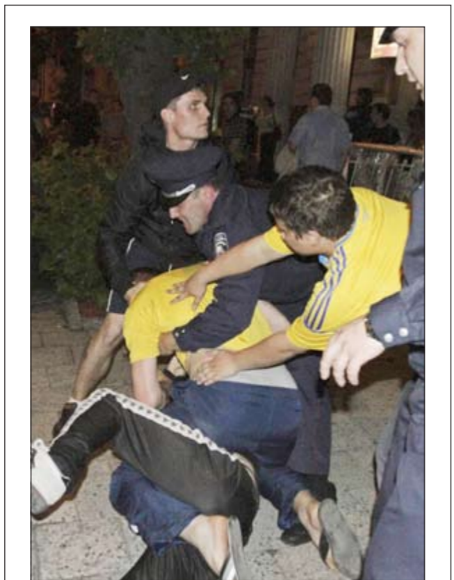
الشرطة الأوكرانية تفصل بين مشجع اوكراني وآخر روسي بعد مباراة روسيا والتشيك

عاد جيرمين ديفو إلى صفوف المنتخب الإنجليزي بعد أن انتهى من مراسم تأبين والده، وأبدى ديفو استعداده للمشاركة ضمن صفوف منتخب بلاده في أولى مبارياته بالمجموعة الرابعة في البطولة الأوروبية والتي يخوضها أمام نظيره الفرنسي غدا، وكان مهاجم توتنهام ديفو (29 عاما) قد غادر معسكر المنتخب في يولندا وسافر إلى بلاده الخميس الماضي بعدما علم بوفاة والده، ولم يكن واضحا حينذاك ما إذا كان سيعود للمشاركة في أولى مباريات المنتخب في يونيو 2012 أم لا. وفي الوقت الذي لا يتوقع فيه مشاركة ديفو ضمن التشكيل الأساسي في المباراة الأولى، يرجح أن يشركه المدير الفني روي هودجسون ضمن التشكيل الاحتياطي في ظل غياب النجم واين روني بسبب الإيقاف. وينتقل المنتخب الإنجليزي اليوم إلى مدينة دونيتسك الأوكرانية حيث ستقام المباراة أمام فرنسا في المجموعة التي تضم أيضا منتخبي أوكرانيا والسويد.