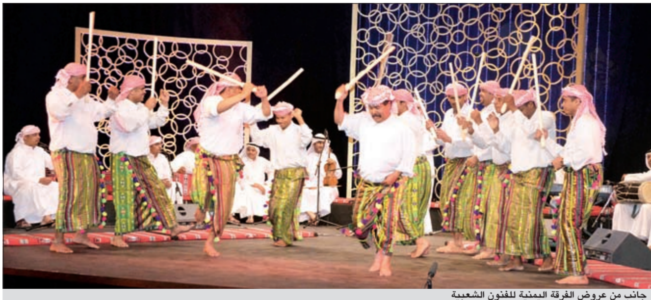
جانب من عروض الفرقة اليمنية للفنون الشعبية