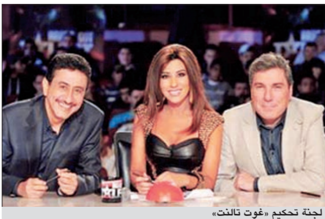
لجنة تحكيم «غوت تالنت»