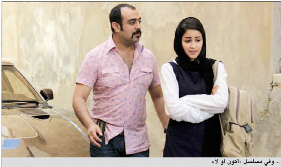
... وفي مسلسل «أكون أو لا»