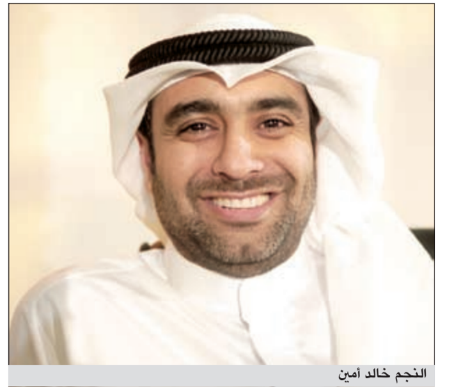
النجم خالد أمين

تحت التعاون المعروف دوما بين الممثلين في منطقة الخليج، مشيرا الى انه سيحدث خلال العمل باللحظة الخليجية البيضاء المزوجة باللحظة العمانية. الجدير بالذكر أن النجم خالد أمين حاز إعجاب النقاد والجمهور من خلال شخصية «عزيز» التي لعبها في مسلسل «أكون أو لا» للمخرج علي العملي والذي عرض على شاشة «ام بي سي» مؤخرا.