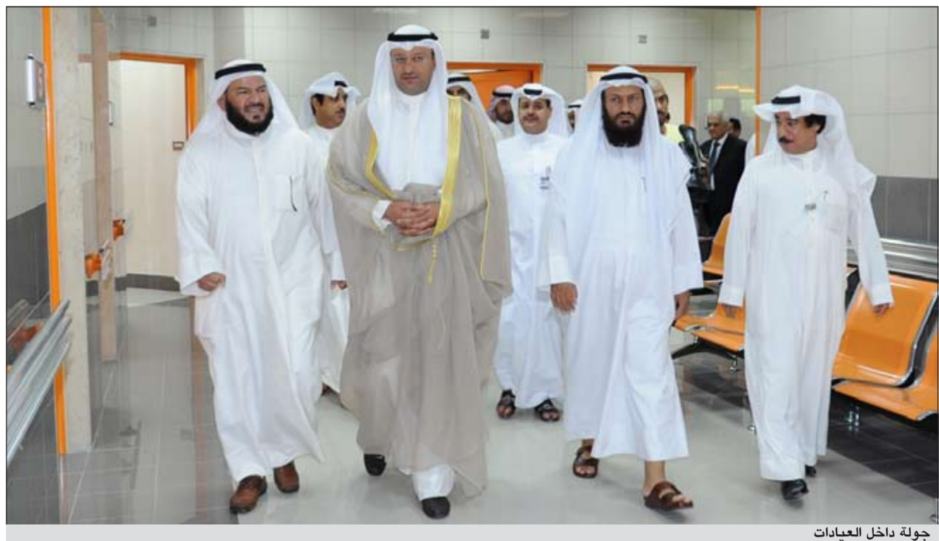
جولة داخل العيادات

الاراضي للعيادات الباطنية بجميع تخصصاته والعظام بجميع تخصصاته الطبية، كذلك الدور الاول يحتوي على الجراحة العامة والمسالك البولية ويحوي قسم الاطفال والنساء والولادة كما يحتوي على غرف للسونار.