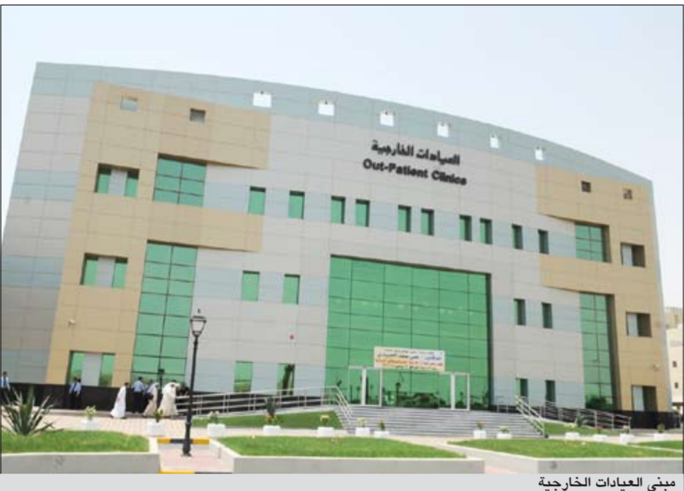
مبنى العيادات الخارجية