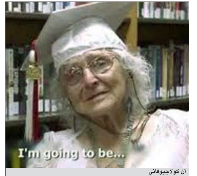
آن كولجيو فاني

شاكير - يوبي.آي: تمكنت امرأة أميركية في الـ 97 من العمر من الحصول على شهادتها الثانوية بعدما كانت قد أجبرت