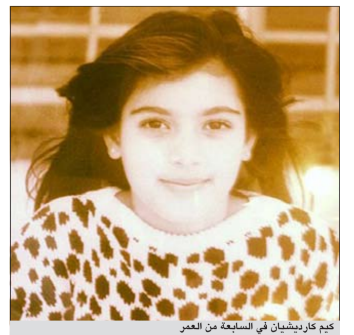
كيم كارديشيان في السابعة من العمر

يذكر أن كيم كارديشيان ظهرت في مباراة الدور النهائي لكرة السلة NBA مع صديقها مطرب الراب الشهير كيني ويست في مركز ستيلين بولاية لوس أنجيليس في كاليفورنيا، وقد التقطت الكاميرات عدداً من الصور للثنائي، وهما يتجاذبان أطراف الحديث أثناء جلوسهما بالصفوف الأمامية بالمدرجات في المباراة.