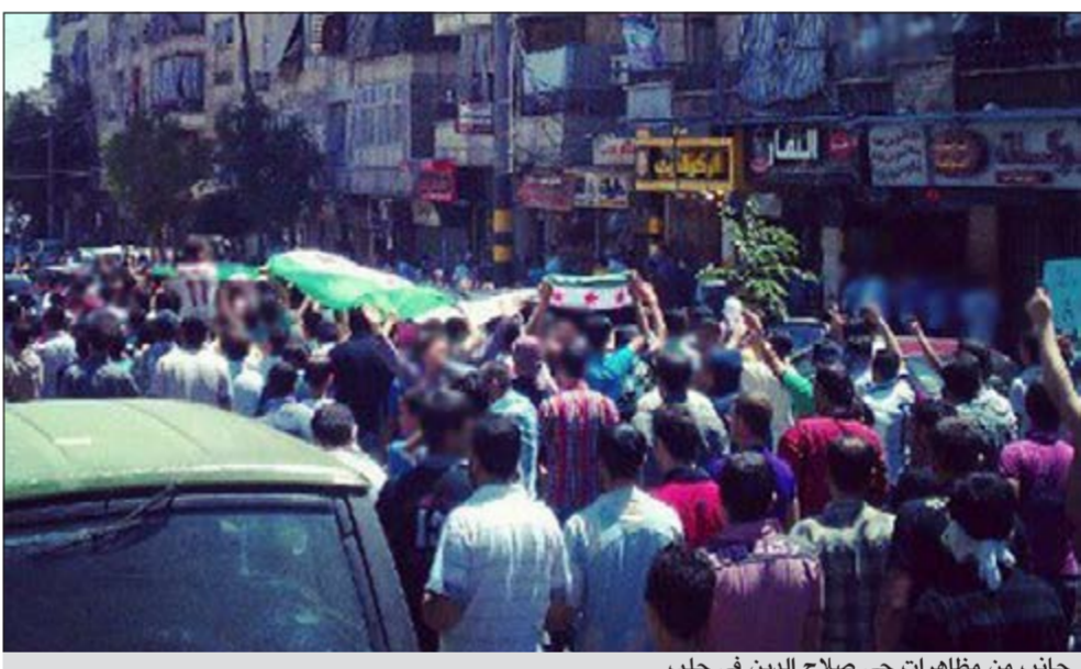
جانب من مظاهرات حي صلاح الدين في حلب

المناقشات ركزت على «حشد الدعم الدولي» لخطة السلام التي قدمها المبعوث المشترك للامم المتحدة وجامعة الدول العربية كوفي أنان، كما تطرقت المناقشات إلى «الجوانب العملية، لمبادرة روسية تدعو إلى عقد مؤتمر دولي بشأن سورية. وعقد الاجتماع في وزارة