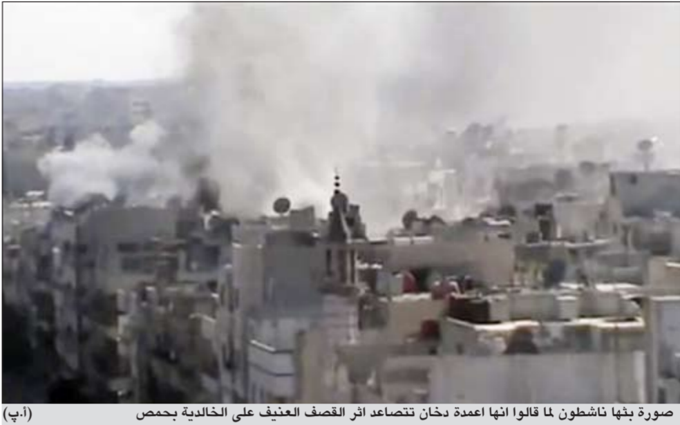
صورة بثها ناشطون لما قالوا انها اعمدة دخان تتصاعد اثر القصف العنيف على الخالدية بحمص

في إشارة إلى غناء أصالة للرئيس السوري السابق حافظ الأسد. وواصل الأسمر أصالة على صفحتها الخاصة على موقع الـ«فيسبوك» على مرتكبي المجازر في سورية، وقالت لهم: «اللهم عليك بعصاية الشر والفساد في سورية، اللهم اجعل كيدهم في تضليل، اللهم صب عليهم سوط عذاب، اللهم أرنا فيهم عجائب قدرتك، وذلك بعد «المنذبة» الأخيرة التي حكى عنها في حماة بسورية والتي راح ضحيتها أكثر من 120 ضحية بينهم أطفال. واكملت أصالة الدعاء بحسب موقع «النشرة»: «اللهم انا نسالك بأنك أنت الواحد القهار، رب كل شيء ومليكه، أنت العزيز المقتدر، ان تخلص المسلمين من طاغية الشام يا ذا الجلال والإكرام، اللهم أرز تولته، وأذهب شوكته، وعجل بهلاكه، اللهم عجل بهلاكه، اللهم عجل بهلاكه، يا جبار، يا قهار، يا متين، يا محيط».