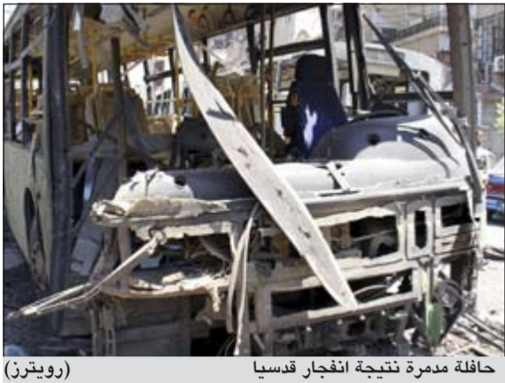
حافلة مدمرة نتيجة انفجار قدسيا

أعلنت السلطات السورية مقتل عنصريين من قوات حفظ النظام وجرح عدد من المدنيين في قدسيا بريف دمشق نتيجة تفجير سيارة مفخخة في البلدة الواقعة شمال غرب العاصمة السورية دمشق، وقالت وكالة الأنباء السورية الرسمية (سانا) إن من تصفها بـ «مجموعة إرهابية مسلحة»، فجرت سيارة مفخخة في شارع الثورة بقدسيا في ريف دمشق ما أدى إلى استشهاد عنصريين من قوات حفظ النظام وأصيب عدد آخر من المدنيين وقوات حفظ النظام في تفجير السيارة المفخخة، وفي مدينة حلب أعلنت الجهات المختصة أنها أحبطت مساء أمس الأول محاولة تفجير سيارة مفخخة قرب دوار جمعية المهندسين بالمدينة، وذكر مصدر مسؤول بالمحافظة لوكالة «سانا» أن عناصر الهندسة قاموا بتفكيك العبوة الناسفة الموضوعة في سيارة سياحية من نوع أفانتي مقدرين وزن العبوة بنحو 500 كيلوغرام». كما ضبطت الجهات المختصة كمية كبيرة ومتنوعة من الأسلحة الحديثة والمنطورة في قرية رأس معرة بيروود في ريف دمشق ضمن سيطرة قادمة من الأراضي اللبنانية تجاه الأراضي السورية في منطقة وادي الفتلة. وتضمنت الأسلحة قنصاات منطوية أميركية الصنع ورشاشات ثقيلة بعضها إسرائيلي وعبوات متفجرة إسرائيلية الصنع وأجهزة تفجير عن بعد وصواريخ من نوع لاو فرنسية الصنع وقنصاات بكوامت صوت وبنادق آلية وقوادف «آر. بي. جي».