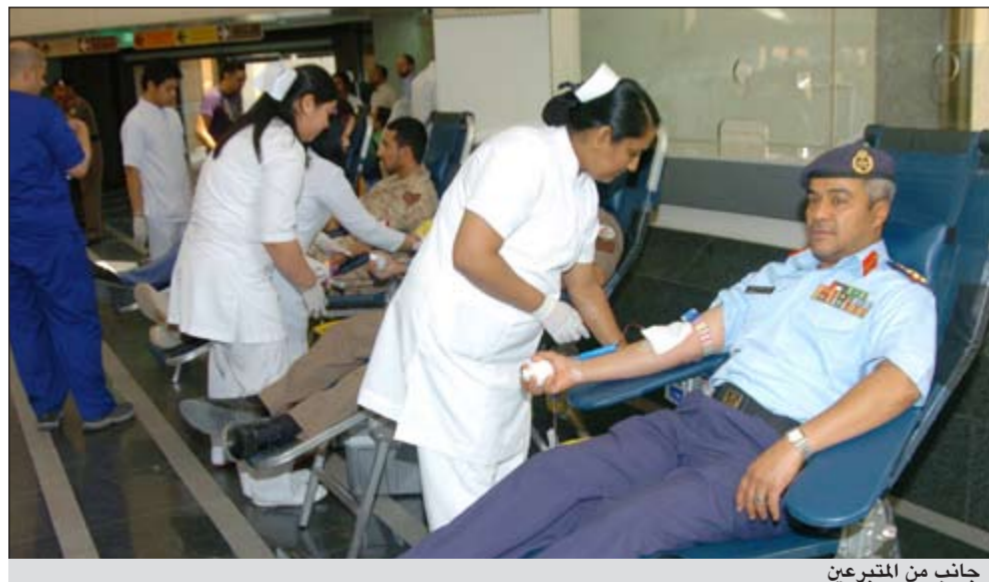
جانب من المتبرعين