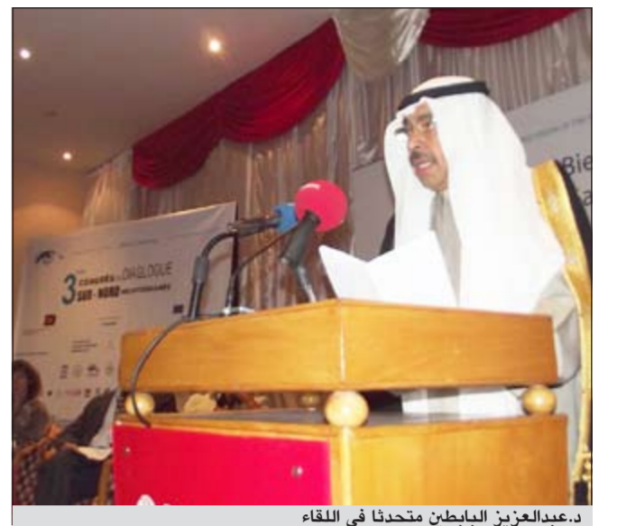
د.عبدالعزیز البابطين متحدثاً في اللقاء