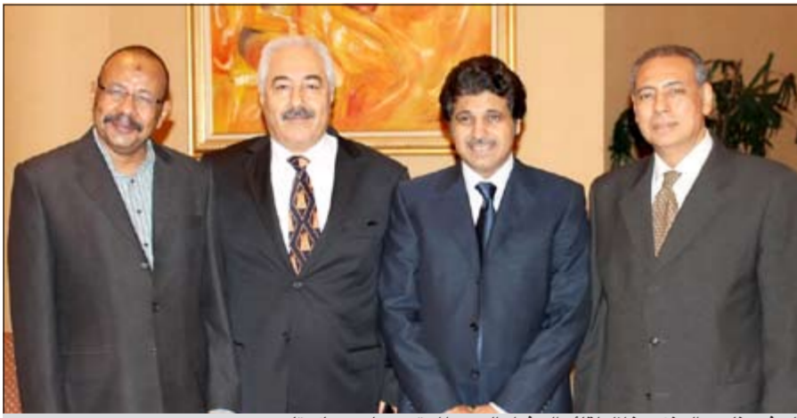
السفير ناصر العنزي خلال لقائه السفراء العرب المعتمدين لدى جاكارتا

كوالابور - كونا: أكد سفيرنا لدى إندونيسيا ناصر بارج العنزي أهمية الدور الذي تقوم به المجموعة العربية في إندونيسيا وما لها من دور فعال في توطيد العلاقة بين الجانبين العربي والإندونيسي، وقال العنزي في تصريح لـ «كونا» أمس إن النشاط الذي قامت به المجموعة العربية في إندونيسيا ممثلة بالسفراء العرب المعتمدين لدى جاكارتا ساهم بشكل كبير في إيجاد تقارب بين الجانبين العربي والإندونيسي ولعل أبرز أوجه هذا التقارب الرؤى المشتركة حيال القضية الفلسطينية.