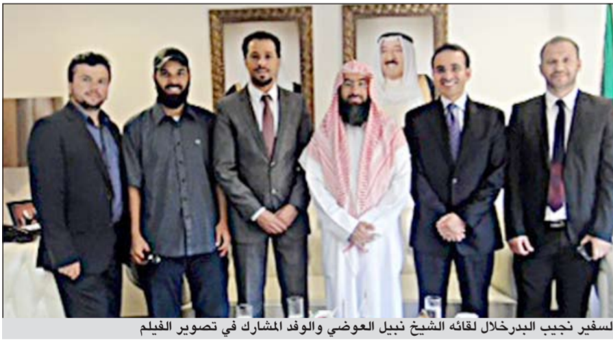
السفير نجيب البدرخلال لقائه الشيخ نبيل العوضي والوفد المشارك في تصوير الفيلم

سراييفو - كونا: أكد سفيرنا لدى جمهورية ألبانيا نجيب عبدالرحمن البدر على أهمية بناء الجسور الثقافية مع جمهورية ألبانيا. جاء ذلك خلال لقاء السفير البدر بالشيخ نبيل العوضي الذي يقوم بزيارة إلى ألبانيا على رأس وفد إعلامي لتصوير فيلم تاريخي وثقافي واجتماعي حول ألبانيا بمقر السفارة في العاصمة تيرانا. وقال البدر لـ «كونا» عقب اللقاء «إن مثل هذا الجهد المميز من قبل الشيخ نبيل العوضي يسهم في تعزيز التقارب الثقافي العربي - الألباني كما يسهم في تعزيز أواصر الصداقة المميز بين الكويت وجمهورية ألبانيا». وبين كذلك في هذه المناسبة أهمية التفاعل والتعاون بين الأمم والشعوب من خلال بناء جسور التواصل الثقافية والإعلامية وتبادل الخبرات مع ألبانيا.