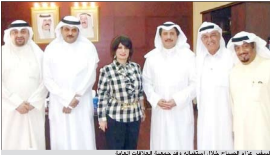
السفير عزام الصباح خلال استقباله وفد جمعية العلاقات العامة

النامية - كونا: أكد سفيرنا لدى مملكة البحرين الشيخ عزام الصباح أن الدبلوماسية الكويتية تقوم على إقامة العلاقات الإيجابية والمتوازنة مع جميع دول وشعوب العالم. جاء ذلك في تصريح للسفير عزام أمس خلال استقباله وفد جمعية العلاقات العامة الكويتية المشارك في الملتقى الخليجي لمارسي العلاقات العامة في البحرين. وقال السفير عزام إن السياسة الكويتية تزخر بإنجازاتها على هذا الصعيد وهو الأمر الذي ظهرت نجاحاته في حجم التأييد والتضامن الدولي الواسع لمختلف المواقف الكويتية.