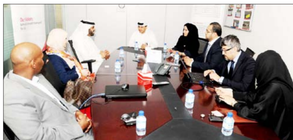
الوفد خلال زيارته هيئة الطرق في دبي