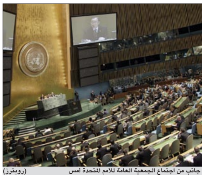
جانب من اجتماع الجمعية العامة للأمم المتحدة أمس

وأعلن الجعفري ان «الحكومة السورية تقف جادة الى جانب كل من يقف بصدق على انجاح هذا الحوار بين النظام والمعارضة»، لافتاً الى ان «بواب سورية مفتوحة لكل من يريد حواراً جاداً، وليس للحكومة السورية اي مشكلة مع المعارضة»، وانما مشكلتها مع من يتاجر بالدم السوري ويوظفه هذه المعارضة ومع من يساء الى الدور المهم للمعارضة الوطنية». من جانبه، أوضح ممثل سورية في الأمم المتحدة بشار الجعفري، في كلمة له في الجمعية العامة