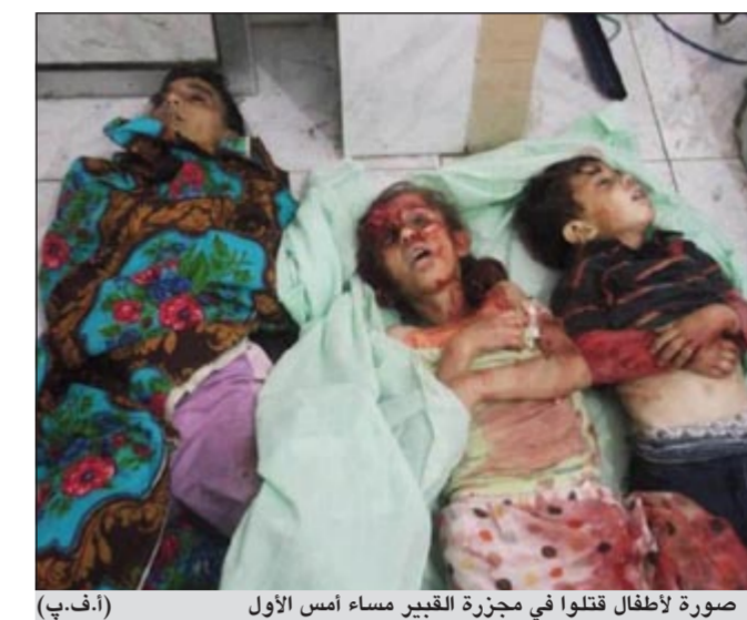
صورة لأطفال قتلوا في مجزرة القبير مساء أمس الأول (أ.ف.ب)

وقال «بشكل صراحة، علي ان الجزرة التي شهدت جريمة ارتكها الإرهابيون وراح ضحيتها 9 من النساء والأطفال»، ونفى المصدر ما تناقلته بعض وسائل الإعلام حول منع مراقبي الأمم المتحدة من الدخول الى مزرعة القبير، مؤكداً ان هناك تسهيلات كاملة للمراقبين بحرية التحرك والانتقال الى أي مكان يختارونه. وفي نيويورك أعلن الأمين العام للأمم المتحدة بان كي مون امس ان مراقبي الأمم المتحدة تعرضوا للإطلاق نار من أسلحة خفيفة» أثناء توجهم لموقع المجزرة. ولم يشر بان كي مون الذي كان يتحدث امام الجمعية العامة للأمم المتحدة في نيويورك، الى سقوط جرحي بين المراقبين، لكنه وصف مسن جهة أخرى