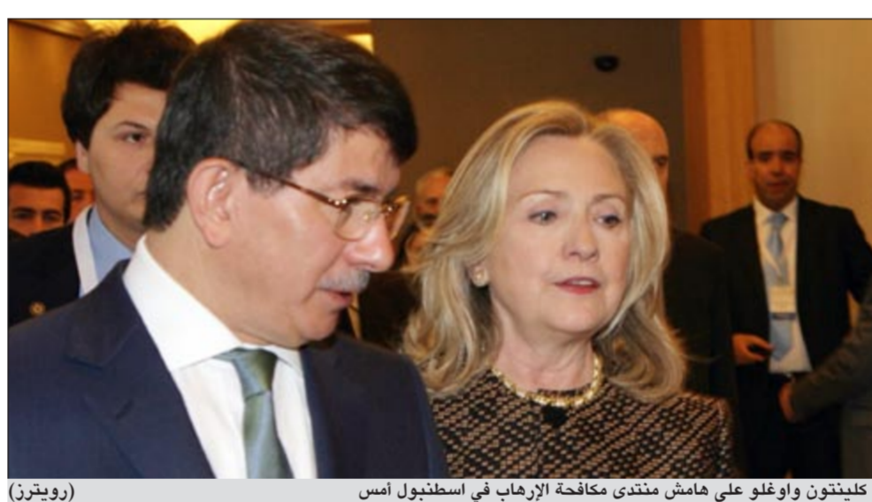
كليتوتون واوغلو على هامش منتدى مكافحة الإرهاب في اسطنبول امس

مساعد الشعب السوري في ظل ترزاد الجعفري، للأسد ضاعف قسوته وعنفه وسورية لا يمكن ان تكون مكاناً آمناً لإبراهيم الاسد والوقت قد حان للمجتمع الدولي ان يتخذ من اجل خطة لما بعد الاسد». وطلبت كليتوتون من الحكومة السورية ان تنفذ الخطة الست بخطة المبعوث الدولي كوفي أنان كاملة، لافتة الى انه بعد رحيل الاسد يجب اقامة حكومة انتقالية لاجراء المفاوضات والتحضير للمرحلة الانتقالية لتحقيق العدالة والديموقراطية.