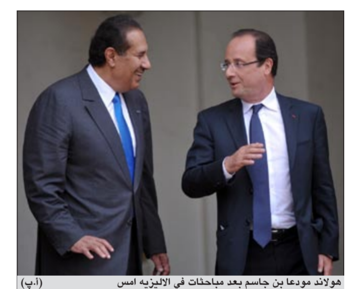
هولاند مودعا بن جاسم بعد محادثات في الإليزيه امس

من جانبه، قال وزير الخارجية التركي أحمد داود اوغلو «ان العنف مستمر ويتصاعد يوماً بعد يوم في سورية ونسوء الأحوال في هذا البلد من دون اي بادرة تحسن، لذا لا يمكن الاستمرار على هذا الوضع الحالي».