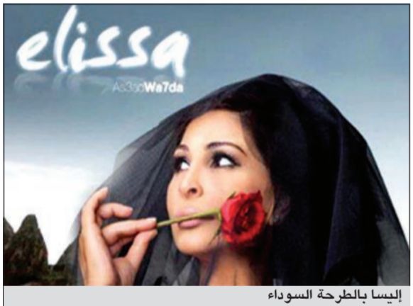
إليسا بالطرحة السوداء

الألحان اليومية الأخير «تصدق بمن»، كما يتضمن الألبوم أغنية الراحلة سلوى القطريب «قالولي العيد بعيونك» التي أعادت إليسا غناءها من جديد.