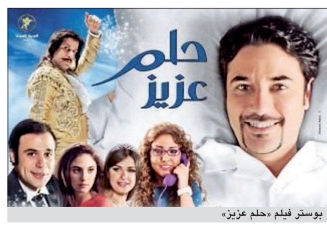
بوستر فيلم «حلم عزيز»