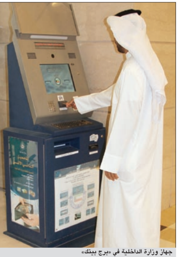
جهاز وزارة الداخلية في «برج بيتك»

وفر بيت الكويتي (بيتك) جهازا إلكترونيا بالتنسيق مع وزارة الداخلية في «برج بيتك» وذلك لتمكين موظفيه وجمهور العملاء ومرتادي المجمع من الاستفسار ودفع المخالفات المتعلقة بإدارتي المرور والهجرة، انطلاقا من حرصه على تسهيل الخدمات على المواطنين والموظفين والعملاء أيضا. وتم تشغيل الجهاز في «برج بيتك» الذي يقع بجوار المركز الرئيسي، حيث يخدم الآلاف يوميا ممن يرتادون المجمع التجاري الذي يضم مجموعة من المطاعم والمحلات والشركات الكبرى ويشهد حركة تسوق متنامية منذ إنشائه. ويحرص «بيتك» على تذليل العقبات أمام المتعاملين وذلك بتوظيف التقنية في صالحهم بغرض توفير الوقت والجهد، كما يعتبر ذلك جزءا من مسؤوليته الاجتماعية وسعيه المستمر إلى تعزيز جودة الخدمة وإضافة كل ما من شأنه رفع مستوى رضا العملاء.