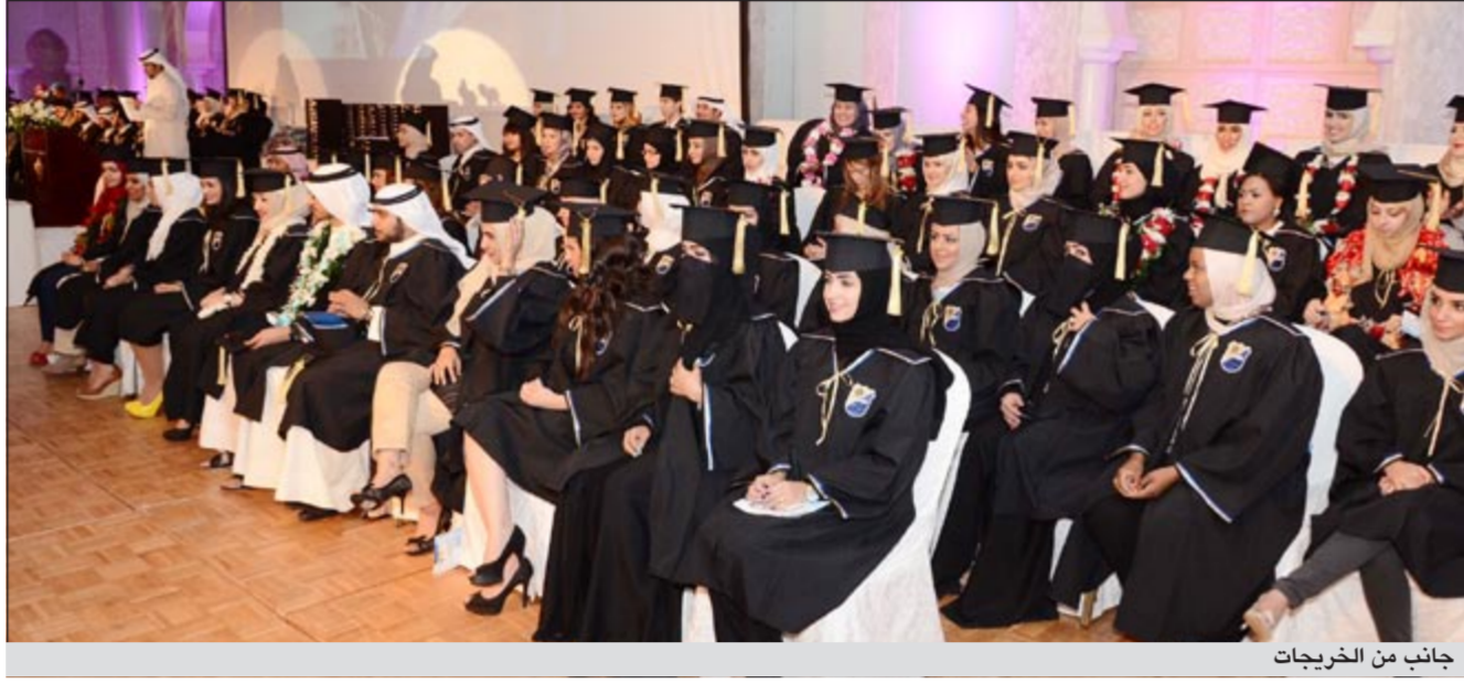
جانبا من الخريجات