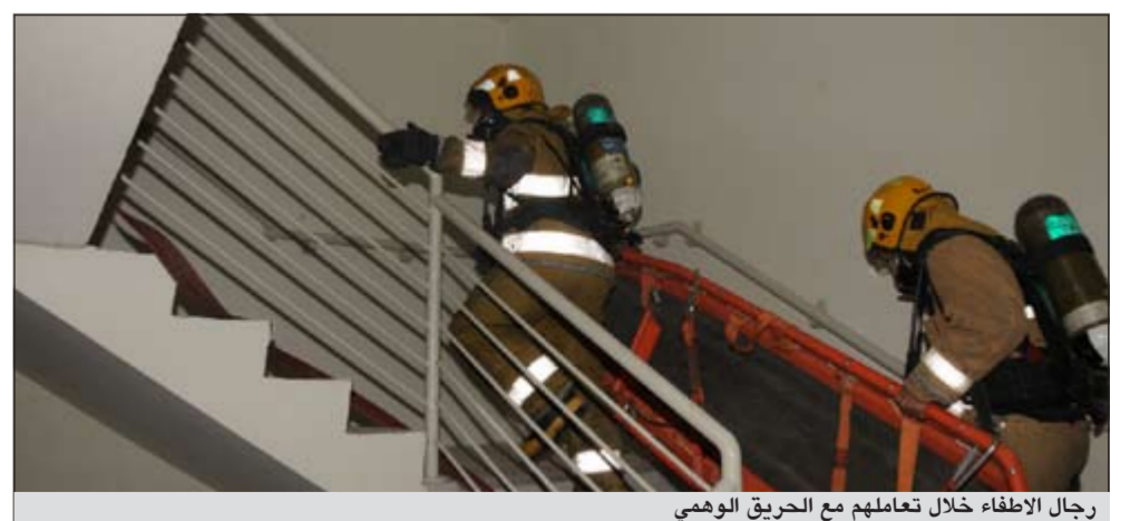
رجال الإطفاء خلال تعاملهم مع الحريق الوهمي