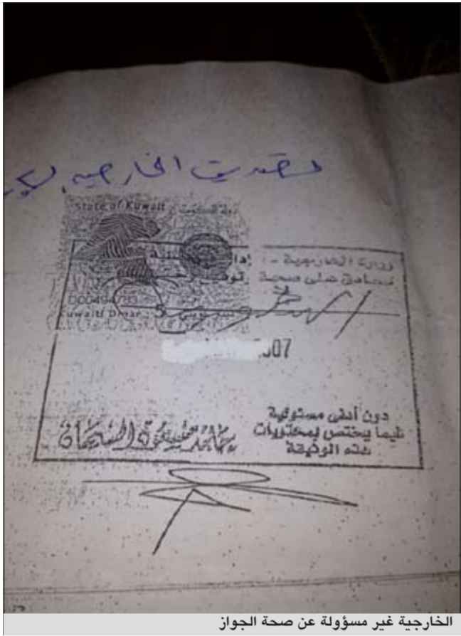
الخارجية غير مسؤولة عن صحة الجواز