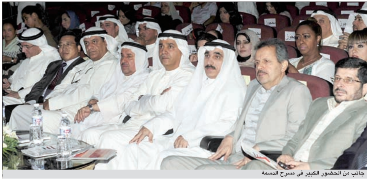
جانبا من الحضور الكبير في مسرح الدمسة