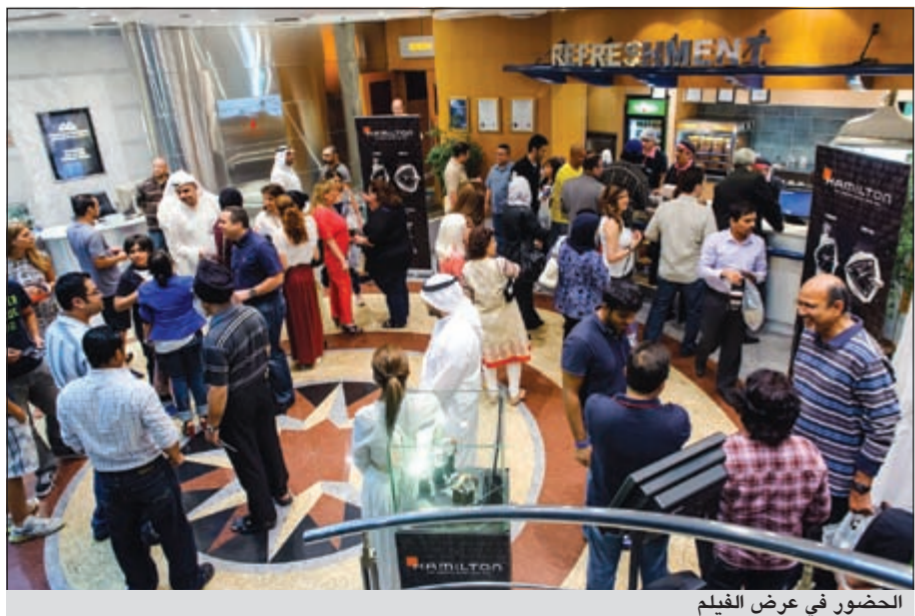
الحضور في عرض الفيلم

في فيلم «Men In Black 3» يعود الزمن بالعملين جيه وكبه الى الوراء، ولقد شاهد العميل جيه اشياء لا يمكن تفسيرها خلال فترة الخمس عشرة سنة التي قضاهها مع عملاء «Men In Black»، لكن لم يزعجه اي شيء حتى الغريب بقدر ما ازعجه شريكه العنيد الكونوم، لكن عندما توضع حياة كيه ومصير الكوكب على المحك سيضطر العميل جيه الى العودة الى الماضي لوضع الاشياء في نصابها الصحيح، ويكتشف العميل جيه ان هناك اسراراً في الكون لم يخبره بها كيه ابداً وهي الاسرار التي ستكشف نفسها عندما يكون قريباً مع العميل الشاب كيه لانقاذ شريكه والوكالة ومستقبل الجنس البشري، اخرج الفيلم باري سوننفيلد، وكتب نص الفيلم ابتان كوهين استناداً الى «مالبو كوميك» التي كتبها لويل كينغهام، المنتجان هما ولتر اف باركس ولوري مكدونالد والمنتجات المتقدان