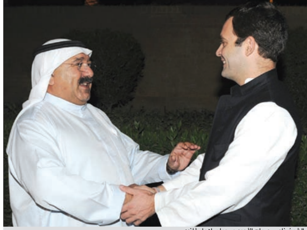
الشيخ ناصر صباح الاحمد مرحبا براهول غاندي