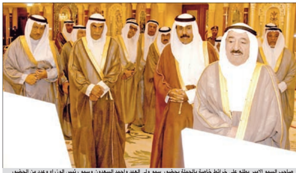
صاحب السمو الأمير يطلع على خرائط خاصة بالحملة بحضور سمو ولي العهد واحمد السعدون وسمو رئيس الوزراء وعدد من الحضور