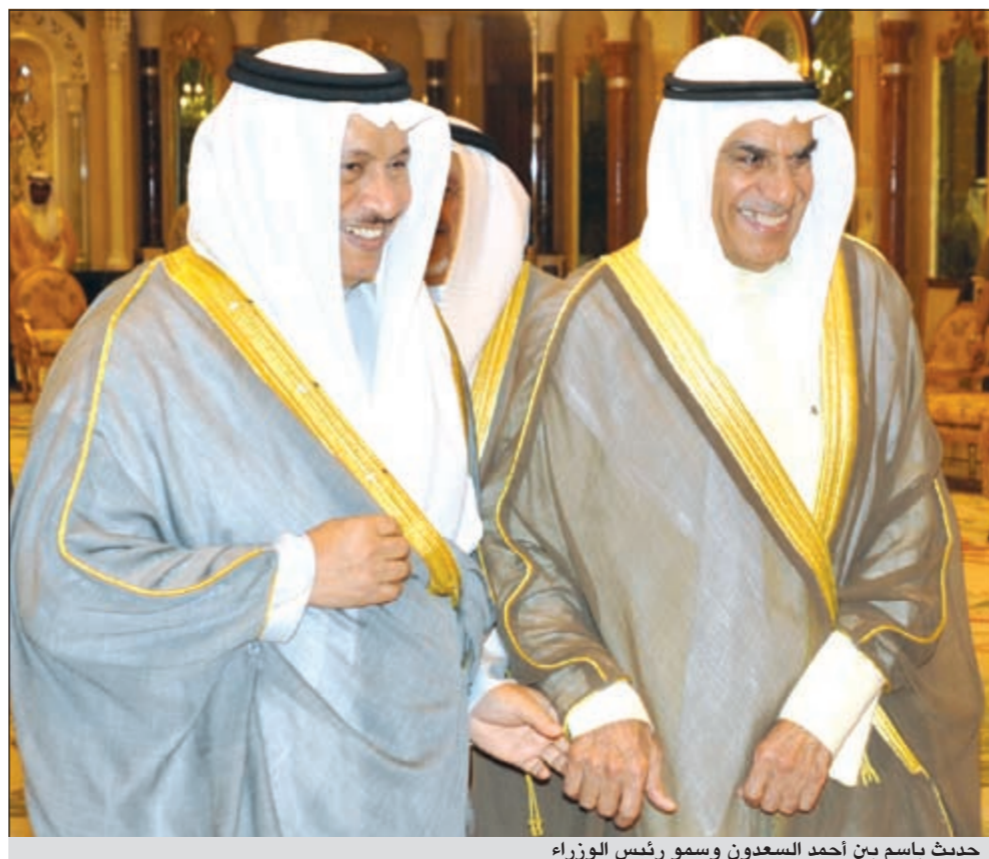
حديث باسم بين احمد السعدون وسمو رئيس الوزراء