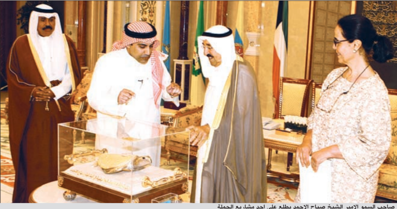
صاحب السمو الأمير الشيخ صباح الأحمد يطلع على أحد مشاريع الحملة