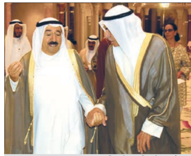
حديث بين صاحب السمو واحمد السعدون

من جهود وطنية فعالة في حماية البيئة البحرية مشكلين بذلك قوة ومثالاً يحتذى به اخوانهم من الشباب متمنيا سموه ان يواصلوا عملهم لتحقيق تطلعاتهم واهدافهم الوطنية.