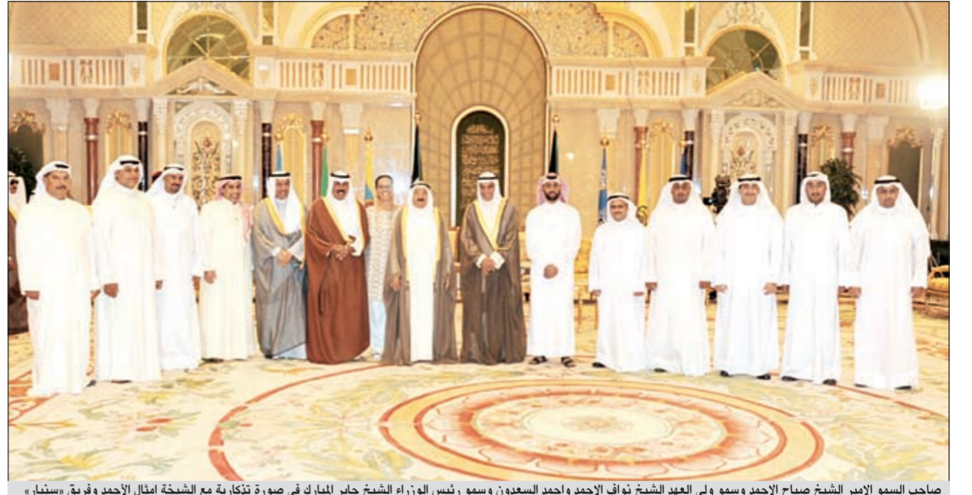
صاحب السمو الأمير الشيخ صباح الأحمد وسمو ولي العهد الشيخ نواف الأحمد وسمو رئيس الوزراء الشيخ جابر المبارك في صورة تذكارية مع الشبيخة أمثال الأحمد وفريق «سنيار»