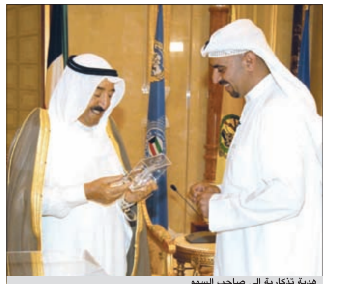
هدية تذكارية الى صاحب السمو

لسموه ولسمو ولي العهد ولسمو رئيس مجلس الوزراء بهذه المناسبة.