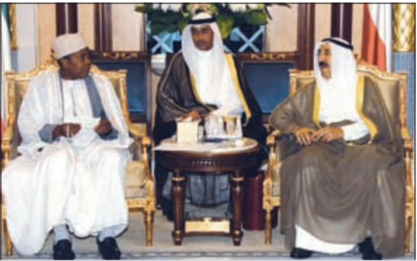
صاحب السمو الأمير خلال لقائه محمد بكري عبدالفتاح

استقبل صاحب السمو الأمير الشيخ صباح الأحمد بقصر بيان صباح امس ممثل الأمين العام للأمم المتحدة لدى بغداد مارتن كوبلر والوفد المرافق وذلك بمناسبة زيارته للبلاد.