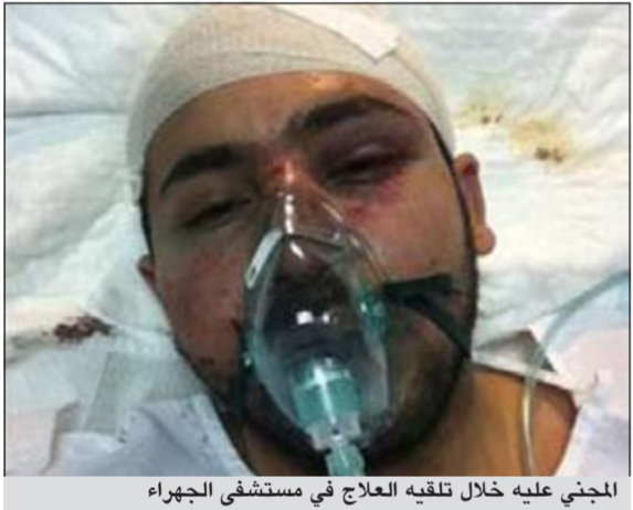
المجنّي عليه خلال تلقيه العلاج في مستشفى الجهراء