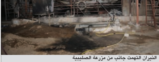
الدخان التهمت جانب من مزرعة الصليبية