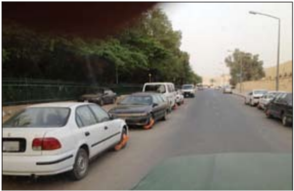
سيارات مكبوحة في الفروانية

ضمن جهود قطاع المرور للحد من المخالفات المرورية والسلوكيات الخاطئة لبعض قاندي المركبات والقيام بالحملات المرورية المفاجئة على مدار الساعة وفي جميع أنحاء البلاد لتأمين سلامة مستخدمي الطريق. قام قسم سير حولي بتحرير 617 مخالفة منها 214 مباشرة و403 غير مباشرة، بالإضافة الى حجز 18 مركبة، وذلك خلال أحد الزامات.