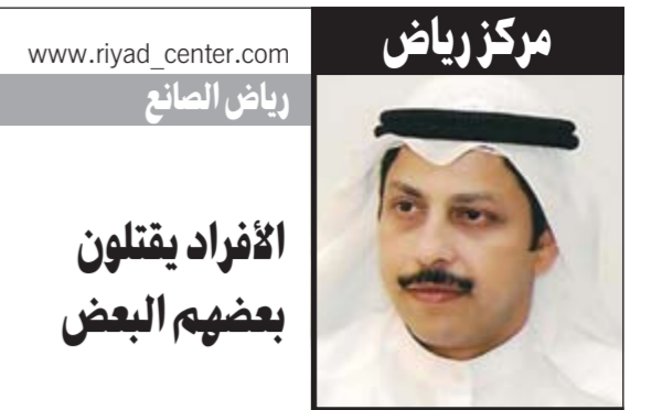
مركزرياض رياض الصانع