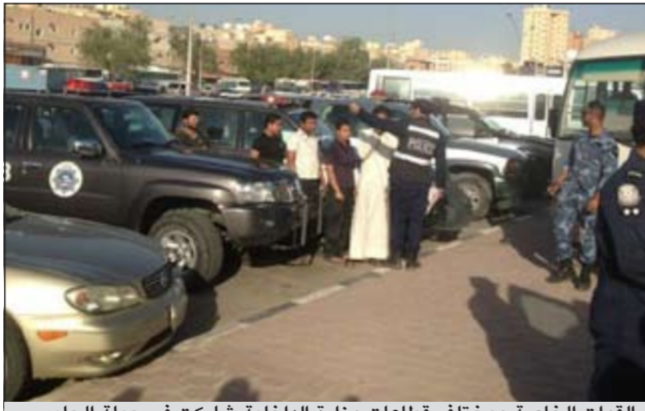
القوات الخاصة ومختلف قطاعات وزارة الداخلية شاركت في حملة الجليب

المصدر ان الحملة شملت مداممة أوكار لتصنيع الخمر المحلية وأخرى للاتصالات الدولية وثالثة للأعمال المنافية للأداب. وأشار