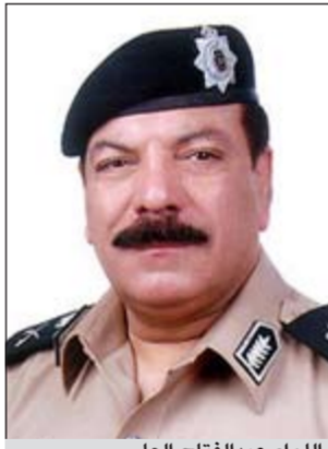
اللواء عبدالفتاح العلي

المصدر ان الحملة شملت مداممة أوكار لتصنيع الخمر المحلية وأخرى للاتصالات الدولية وثالثة للأعمال المنافية للأداب. وأشار