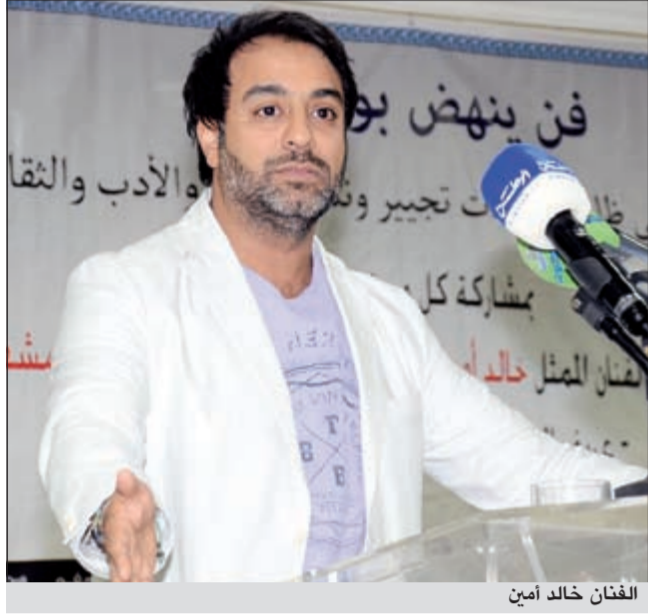
الفنان خالد أمين

وفي الختام استمع الحاضرون الى عمل راق قام به الفنان مشعل العروج وهو التعبير الرائي عن هموم المواطن بدل ثقافة الاقتحام والابتذال اللفظي.