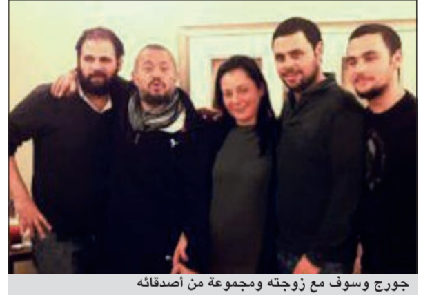
جورج وسوف مع زوجته ومجموعة من أصدقائه