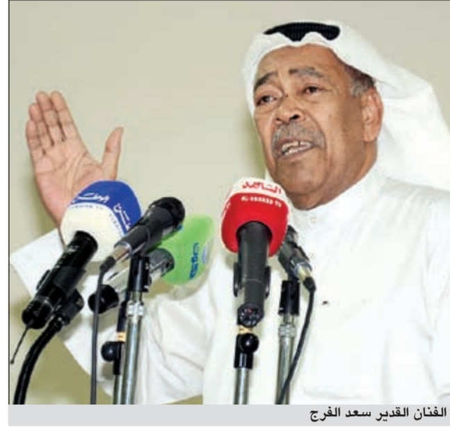
الفنان القدير سعد الفرج

السياسية التي تصل أحيانا الى حد الابتذال. ومن ثم اعلى المنصة الفنان القدير سعد الفرج الذي استقبل بترحيب شديد من قبل الحاضرين. واستعرض خلال كلمته نماذج لفنانين قاموا بتحريك ثورات اجتماعية وثقافية واستنكرت بكلمات تحمل الألم تاريخه الذي يدها مع زملائه على المسرح فور عودته من رحلة الدراسة في أميركا، مبيهاً ان جمعية الإصلاح دعت حينها لإنشاء