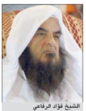
الشيخ فؤاد الرفاعي

وقال الرفاعي: لا يجوز شرعاً إقامة كنائس جديدة بعدما تفتح البلاد، وتعلوها كلمة التوحيد - ذلك إلى يوم القيامة - مهما تغيرت الظروف! وتغيرت نسبة السكان! ودعت الحاجة إلى ذلك! لأن الأصل ان الإسلام هو الذي ينتشر لا غيره من الأديان، ولا يجوز ان يسمح بإنشاء هذه الكنيسة أو غيرها تحت ما يسمى بمبدأ: حرية الدين أو حرية الاعتقاد التي ينادي بها الديموقراطيون