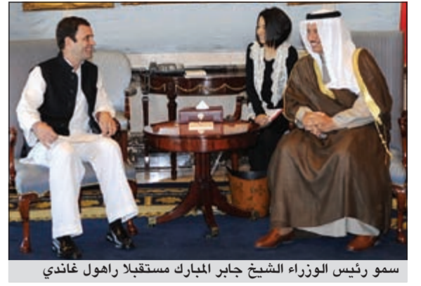
سمو رئيس الوزراء الشيخ جابر المبارك مستقبلاً راهول غاندي

استقبل سمو الشيخ جابر المبارك رئيس مجلس الوزراء في قصر السيف أمس أمين عام حزب المؤتمر الرئيسي في الائتلاف الحاكم لشؤون الشباب بجمهورية الهند راهول غاندي والوفد المرافق له وذلك بمناسبة زيارته للبلاد. حضر المقابلة الوكيل بديوان سمو رئيس مجلس الوزراء الشيخ فهد جابر المبارك.