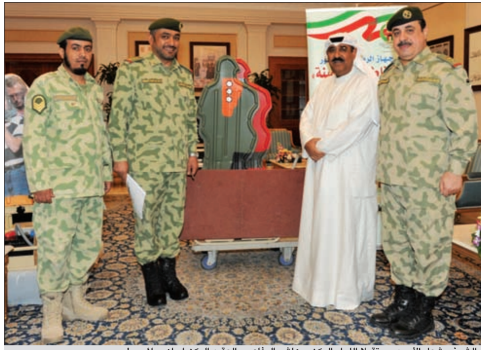
الشيخ مشعل الأحمد مستقبلاً اللواء الركن م. هاشم الرفاعي والعقيد الركن إبراهيم المسيطير

الرمية لمنتسبي الحرس الوطني، وتسعى نحو توفير جميع الإمكانيات المطلوبة لارتقاء بمستوى مهاراتهم وقدراتهم للوصول إلى مستوى الاحتراف في التدريب والرمية. حضر المقابلة مدير مكتب نائب رئيس الحرس الوطني العميد جمال محمد الذياب.