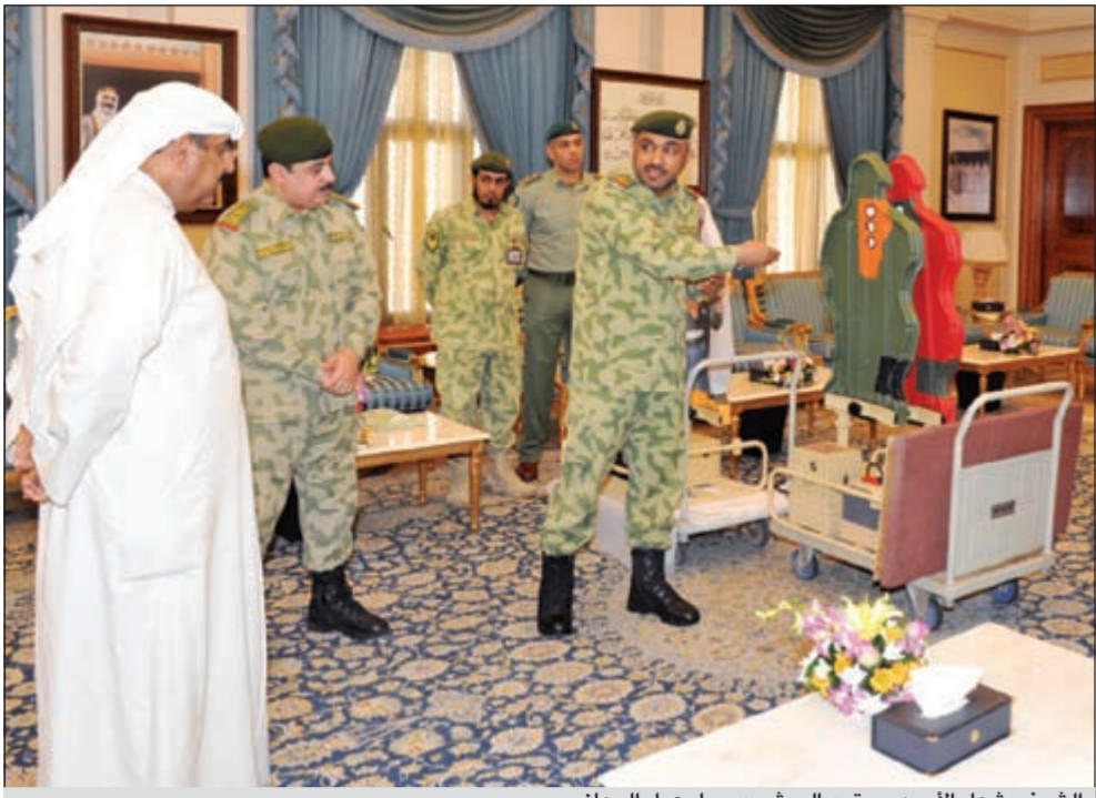
الشيخ مشعل الأحمد يستمع إلى شرح حول عمل الجهاز