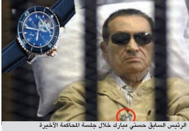
الرئيس السابق حسني مبارك خلال جلسة المحاكمة الأخيرة

من جهة أخرى، مع انتهاء آخر ضوء في شمس السبت الثاني من يونيو بدأت الليلة الأولى للرئيس السابق حسني مبارك في سجن مزرعة طرة صباح أنه كان على سريريه الطبي الشهير، والذي أصبح من علامات الحكام ورؤساء الدول السابقين، وصحيح أيضا انه كان في مستشفى سجن المزرعة وليس في سجن