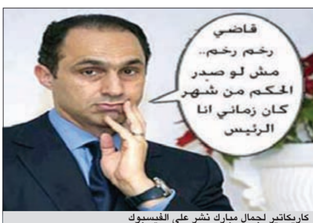
كاريناجر لجمال مبارك نشر على الفيسبوك

كما اصططحت هايدى راسخ خلال زيارتها لزوجها النجل الأكبر لمبارك حفيبتين سوداوين