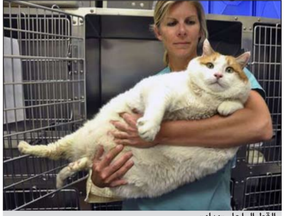
القط الراحل «مياو»

نيويورك - يوبي.آي: يتنافس هران في مدينة نيويورك على لقب «أسمن هر» بعد أن نفق حامل اللقب السابق الهر «مياو» الذي كان وزنه 17 كيلوغراما. وكان «مياو» الذي اشتهر بعد اطلاقته التلفزيونية في برنامج «توداي» و«اندرسون كوبر» من مدينة سانتا في نفق في نهاية مايو الماضي بعد معاناته مع فشل كلوي. ونشرت صحيفة «نيويورك بوست» السبت الماضي صورة لهر بلما في مانهاتن يدعى «سبونج بوب» وزنه 13,6 كيلوغراما قالت انه حامل للقب الجديد. غير أن الهر «غارفيلد» البالغ من العمر 10 سنوات في لونغ آيلند تفوق على «سبونج بوب» حين ظهر في الإعلام الأحد الماضي واتضح أن وزنه 18 كيلوغراما. ويقول المشرفون على «غارفيلد» ان عليه ان يفقد 9 كيلوغرامات من وزنه على الأقل ليكون بصحة جيدة.