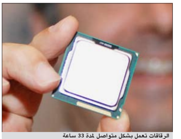
الرقاقات تعمل بشكل متواصل لمدة 33 ساعة

نيويورك-د.ب.أ: أعلنت شركة ديل للكمبيوتر عن سلسلة جديدة من أجهزة الكمبيوتر المحمول من فئة «لايتنيوم» تعمل بأحدث معالجات شركة إنتل للرقاقات الإلكترونية ويمكنها أن تعمل بشكل متواصل لمدة 33 ساعة تقريبا دون الحاجة لإعادة شحن، ولكن شريطة تشغيلها بحزم البطاريات المرفقة. وتعمل سلسلة الكمبيوترات المحمولة الجديدة من فئة لايتنيوم إي بشاشات يتراوح حجمها بين 12,5 و15,6 بوصة.