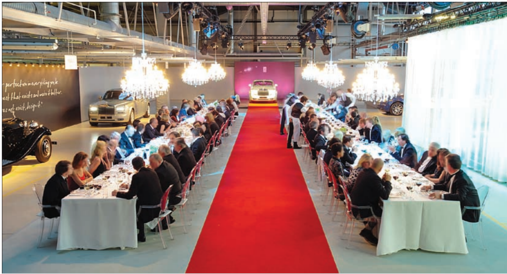
عشاء «رولز- رويس موتور كارز» أثناء عشاء فاخر على خط الإنتاج في مصنع الشركة في جوودو - إنجلترا

وكان مظهر خط الإنتاج مختلفاً حينها، حيث انسدلت الخربات الفاخرة المصنوعة من الكريستال وامتدت وليمة ضخمة جمعت العملاء وهم يكامل أناتهم ليستمتعوا بالعشاء الذي أقيم في نفس