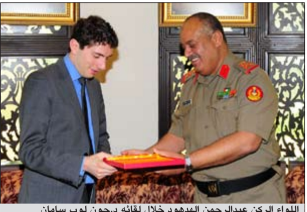
اللواء الركن عبدالرحمن الهدود خلال لقائه دجون لوب سامان