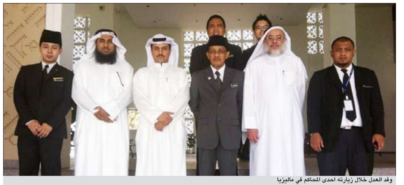
وفد العدل خلال زيارته احدى المحاكم في ماليزيا