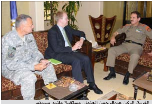
الفريق الركن عبدالرحمن العثمان مستقبلا ماثيو سيبينس

دجون لوب سامان مستشار هيئة التدريب في قسم الشرق الأوسط لدى كلية الدفاع التابعة لحلف شمال الأطلسي الناتو، بمناسبة زيارته للبلاد، حيث تم خلال اللقاء تبادل الاحداث الودية ضمن محور الزيارة ومناقشة اهم الامور والمواضيع ذات الاهتمام المشترك.