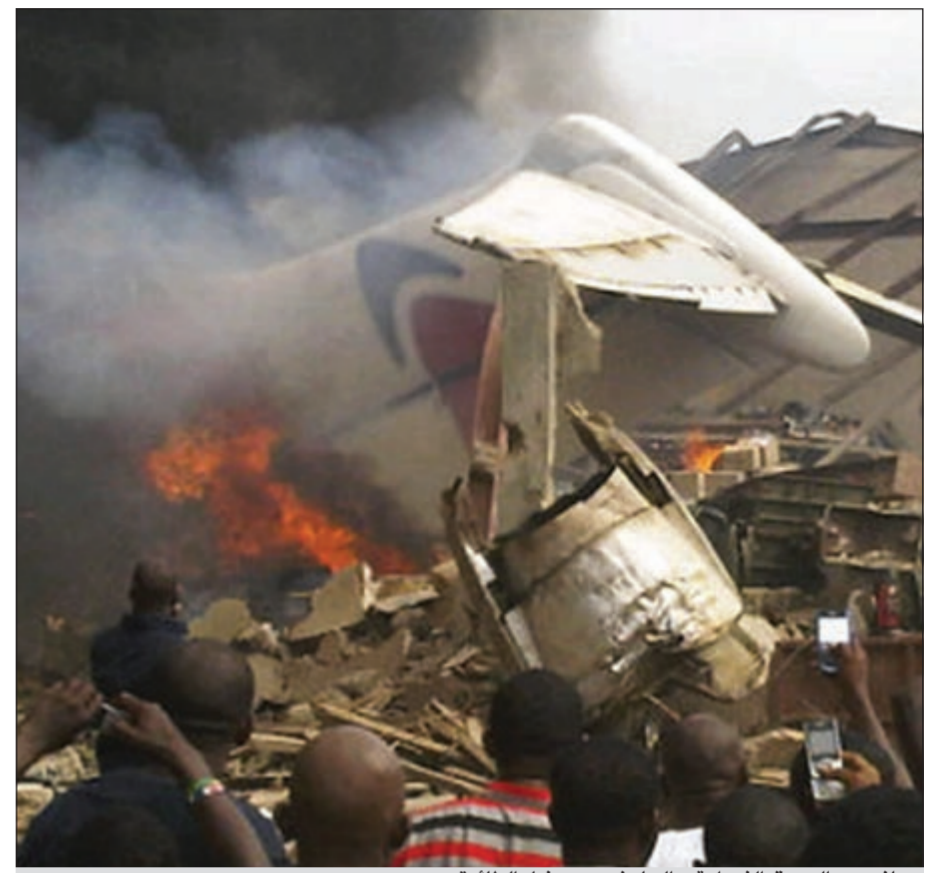
جانبا من الحريق الذي عقب الحادث ويبدو ذيل الطائرة

لاغوس - رويترز: أعلن مدير الطيران المدني في نيجيريا هارولد ديمورين ان طائرة مدنية تقل 153 شخصاً تحطمت الأحد فوق أحد أحياء لاغوس العاصمة الاقتصادية لنيجيريا. وقال المصدر نفسه: الطائرة تابعة لشركة دانا وكانت آتية من العاصمة أبوجا الى لاغوس وعلى متنها 153 شخصاً، مضيافاً: لا اعتقد ان هناك ناجين من الحادث.