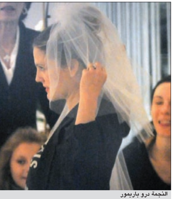
النجمة درو باريمور

ومن بين المشاهير حضرت الممثلة كامرون دياز والممثلة ريزي ويذرسبون وزوجها نيم توث والممثل جيمي فالون وزوجته نانسي جوفونين والممثلة بيزي فيليبس وزوجها. وأشار الى أن الممثلة على علاقة بكوبلمان منذ 2011 وقد تأكدت خطوبتهما في بداية يناير الماضي.