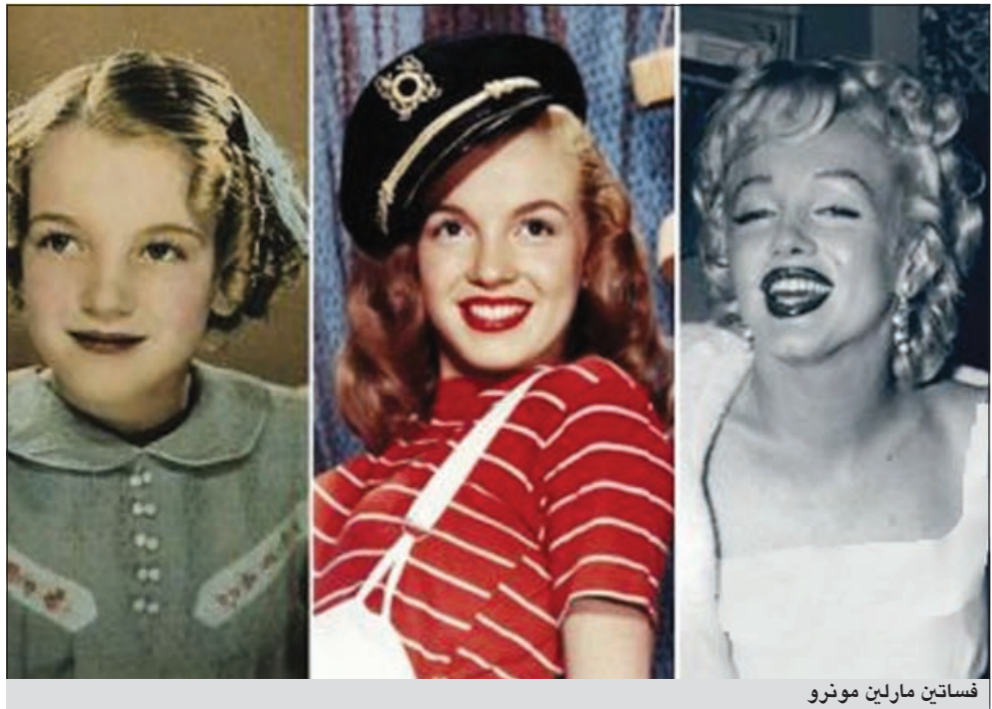
فساتين مارلين مونرو

خلال جلسات التصوير الأخيرة مع «جورج ياريس» على شاطئ البحر. ويتضمن المعرض أيضاً ملابس ارتدتها في أفلامها وقوارير عطر، ونسخاً عن سيناريوهات تحمل ملاحظات دونتها النجمة. وعلى مسافة قريبة من هوليوود ميوزيوم، بدأ مسرح «جرومانز تشاينيز ثياتر» إحدى دور السينما التاريخية في هوليوود، التي يترك النجوم بصماتهم في الإسمنت أمامها، منذ الجمعة، بدأ عرضاً استعراضياً يستمر أسبوعاً لأشهر أفلام مارلين مونرو.