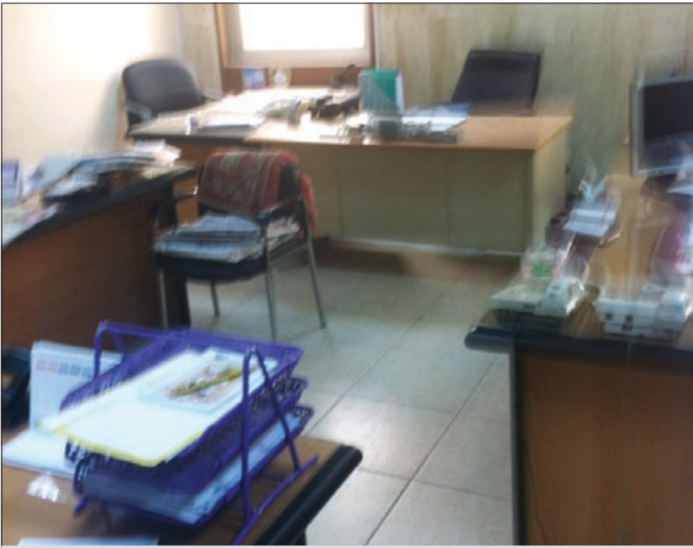
أحد المكاتب الحكومية .. بلا موظفين بسبب الغبار

وموجة غبار، رصدت «الأنباء» عدداً من الوزارات، ومن أبرز الوزارات التي تالت نصيبها من الغيابات والخروج المبكر لموظفيها وزارة الأشغال التي هي