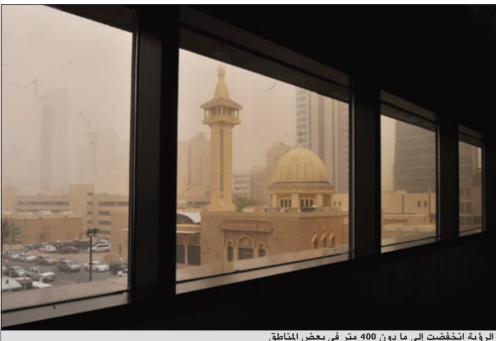
الرؤية انخفضت إلى ما دون 400 متر في بعض المناطق

في الميناء اشار البحري الى وجود خمس سفن في منطقة الانتظار في حين يوجد في منطقة الخروج سفينة وانتظار تحسن الأحوال الجوية للمغادرة متوقفاً