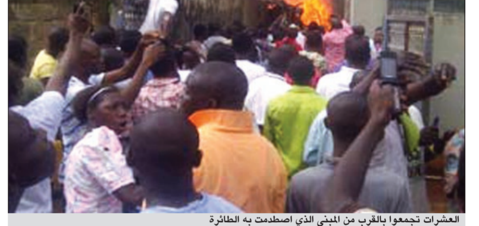
العشرات تجمعوا بالقرب من المبنى الذي اصطدمت به الطائرة

وقال يوشوا شعيب، المتحدث باسم وكالة الطوارئ الوطنية، انه يتعذر تأكيد حصيلة القتلى. وتم إغلاق مطار لاغوس فيما تم إبلاغ الركاب الذين ينتظرون رحلات جوية أخرى بالمغادرة.