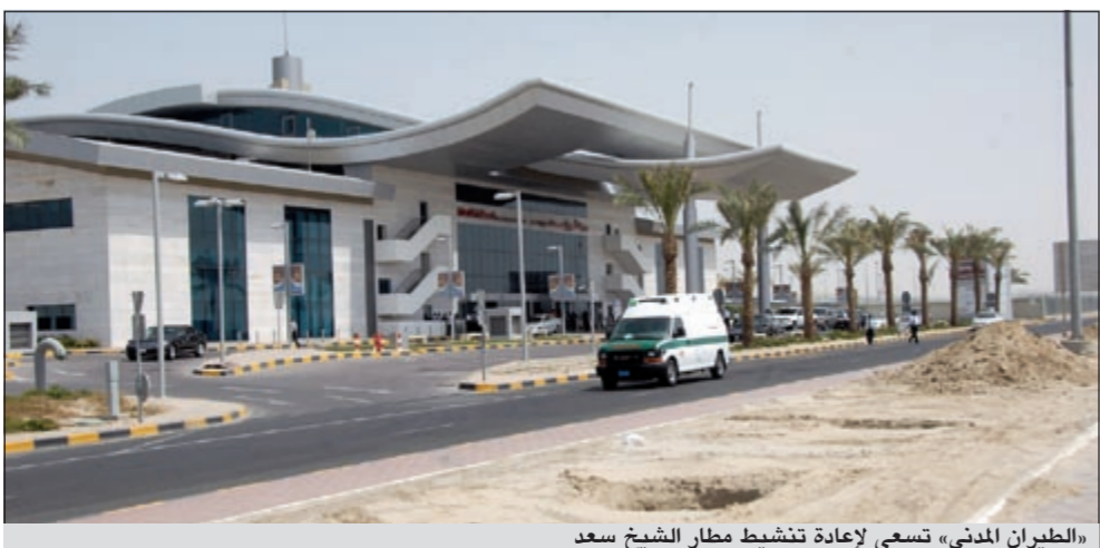
«الطيران المدني» تسعى لإعادة تنشيط مطار الشيخ سعد

الرئيسي أبدى تفهما كبيرا وتعاوناً واضحاً مع الشركة نظراً لما أبدته ميادين من جدية واضحة في اعمال التطوير سواء من خلال: الالتزام بدفع الأقساط المستحقة عن الأرض في المواعيد المحددة، حتى بلغت نسبة السداد 70% من قيمة الأرض الأراضي، كما في عقد الشراء. الا انه مع امداد الفترة الزمنية، بدأ المطور الرئيسي في مطالبة الشركة بسداد المبالغ المستحقة وما ترتب عليها من فوائد تأخير. هذا وقد شهدت الأسابيع الأخيرة الماضية جولة من المراسلات والاتصالات بين الطرفين للتوصل الى حل برضي جميع الأطراف، خاصة ان المطور الرئيسي خلال هذه الاتصالات أوضح بشكل قاطع استعداده لتسليم صكوك ملكية تلك الأراضي وذلك