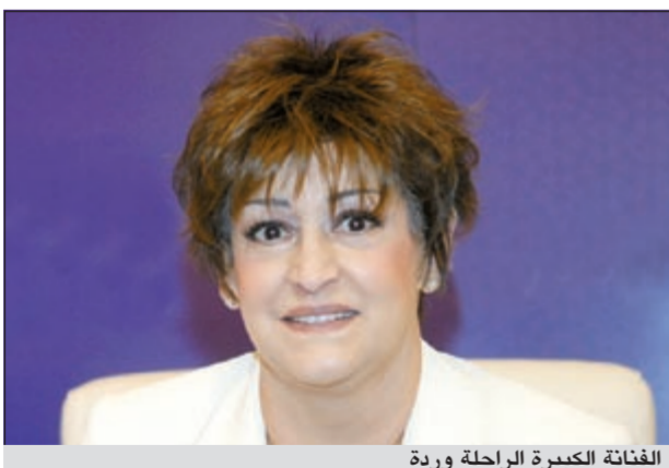
الفنانة الكبيرة الراحلة وردة