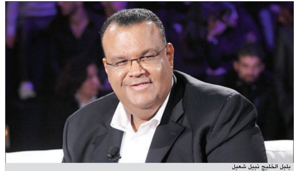
نبيل الخليل نبيل شعيل

أنه أحب أغاني المسلسلات، خصوصاً أغنية مقدمة «غنى» على قناة الـ «MBC»، بلبل الخليل الفنان القدير نبيل شعيل، حيث دار النقاش حول الأغاني التي قدمها عمالقة الطرب العربي، إلى جانب محاور أخرى عرضها شعيل على المشاهدين. وفي بداية الحديث، أشار بوشعيل إلى أن أول أغنية قدمها أمام الجمهور كانت تحت عنوان «سكة سفر» والتي لاقت استحساناً كبيراً في العالم العربي كافة وخصوصاً في مصر، لافتاً إلى أن ظهوره الأول أمام الناس كان من خلال المسرح في الكويت وليس من خلال البوم غنائي، مشيراً إلى