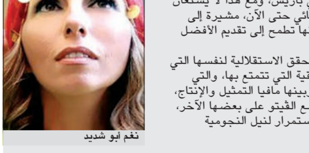
نغم أبو شديد

كشفت الفنانة اللبنانية نغم أبو شديد انها فكرت بالانتحار خلال مراهقتها، وقالت نغم في مقابلة مع برنامج «Dr.VIP» على قناة «Otv» اللبنانية الفضائية: ان سبب تفكيرها بهذا الامر يعود إلى انها لم تجد أجوبة مقنعة على بعض الاسئلة المرتبطة بوجود الله سبحانه وتعالى، فضلا عن أشياء وموضوعات كثيرة في الحياة. وأبدت الفنانة اللبنانية استياءها الشديد من بروز نجوم ونجمات على الساحة الفنية حاليا لا يصلحون للتمثيل، لإيصال شذات في الوقت نفسه إلى أن هذه النوعية من الفنانين بدأت تندثر في الآونة الأخيرة، لافتة الى أنها