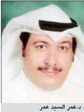
د.عمر السيد عمر

اعلن وكيل وزارة الصحة لشؤون الادوية والتجهيزات الطبية د.عمر السيد عمر عن قبول 15 صيدليا من اجازات الامتحانات لابتعاثهم للخارج للحصول على شهادات عليا في الصيدلة الإكلينيكية، مشيرا الى ان هناك توجه لزيادة هذا العدد خلال السنوات المقبلة. وأكد د.عمر في تصريح صحفي امس على اهمية الصيدلة الإكلينيكية ودورها في ترشيد استهلاك الدواء والاختيار الامثل له. وأشار الى ان برنامج الصيدلة الإكلينيكية موجود منذ التسعينيات الا انه جار تفعيله حاليا بحيث يتم تخريج اشخاص من حملة الماجستير والدكتوراه حاصلين على الصيادلة الإكلينيكية باعتبارها جزءا مهما من علوم الصيدلة. من جانبه اكد مدير مستشفى مبارك الكبير د.صلاح الشاذلي ان قسم الحوادث في المستشفى يستقبل يوميا 1200 مريض، مشيرا الى ان هذا الرقم في تزايد مستمر. و اضاف هناك 465 مريضا يرقد في المستشفى موضحا ان 95% منهم في اقسام الأطفال والباطنية والجراحة، مبينا انه تمت اعادة تأهيل قسم العمليات الكبرى والذي يضم 8 غرف لإجراء عمليات جراحة عامة والوعوية الدموية والمسالك البولية.