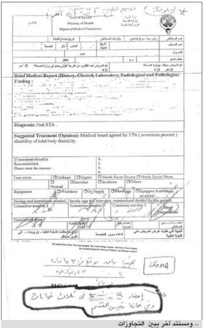
.. ومستند آخر يبين التجاوزات