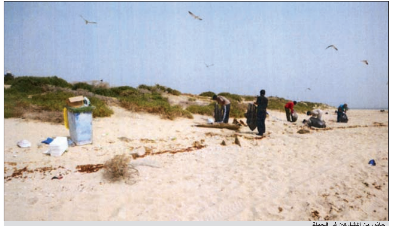
جانب من المشاركين في الحملة

اطار حرصها على الحفاظ على البيئة وتشجيع المواطنين والمقيمين على الحفاظ على البيئة نظيفة.