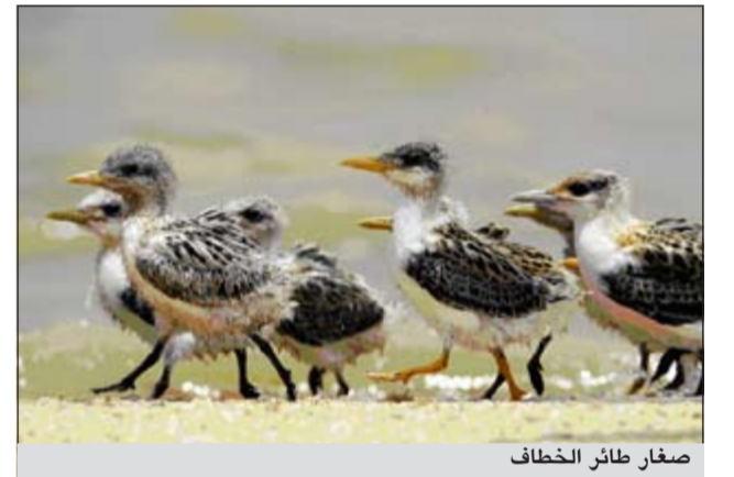
صغار طائر الخفاف