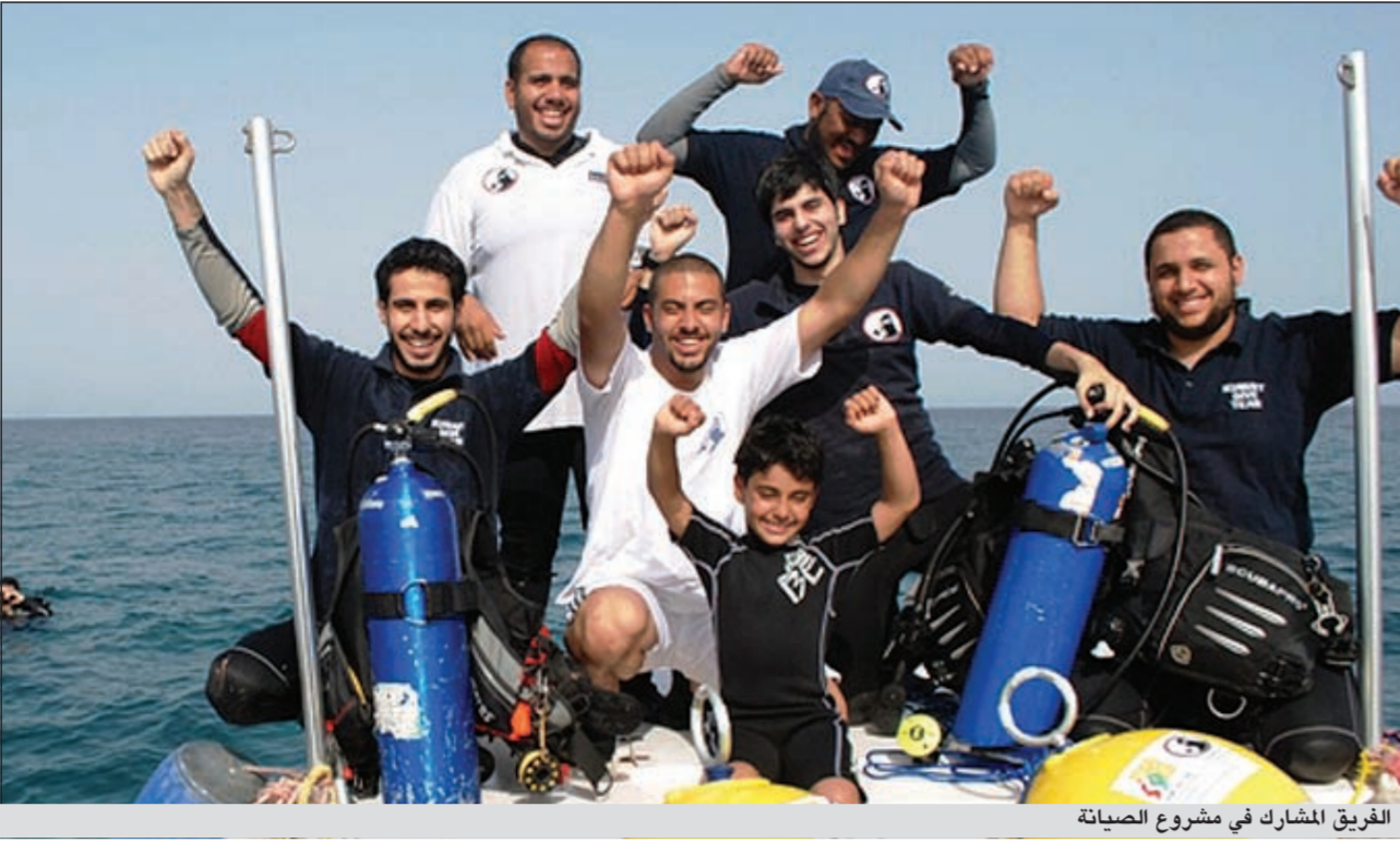
الفريق المشارك في مشروع الصيانة