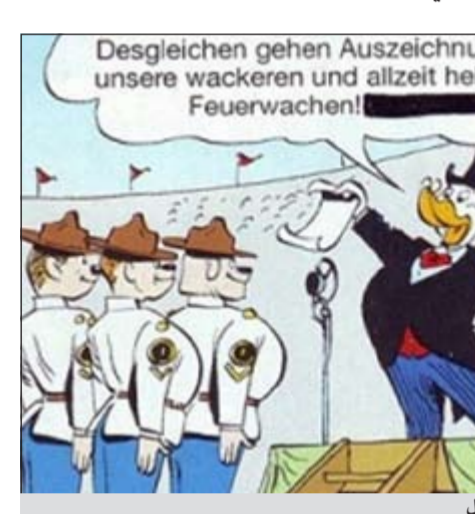
الكارتونير الخبير للجدل

لكنه يختتم جملة هذه بإضافة كلمة «المحرقة» وفورا سارع الناشر، دار «إيغوموند إيهابا»، على لسان ناطق باسمه إلى القول إن خطأ طباعيا هو المسؤول عن الأمر برمته. وقال إن المقصود هو كلمة «الحريق» وليس «المحرقة». وأضاف قوله إن العاملين بالدار «تولوا شطب كلمة «المحرقة» بالحبر الأسود على كل النسخ بانتظار إعادة طباعة العدد من دون الكلمة المسيئة».