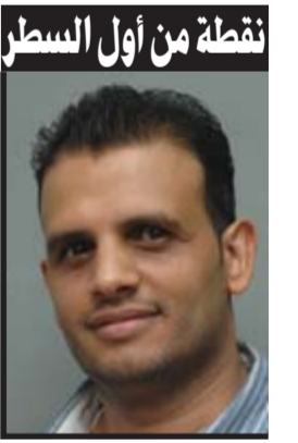
نقطة من أول السطر