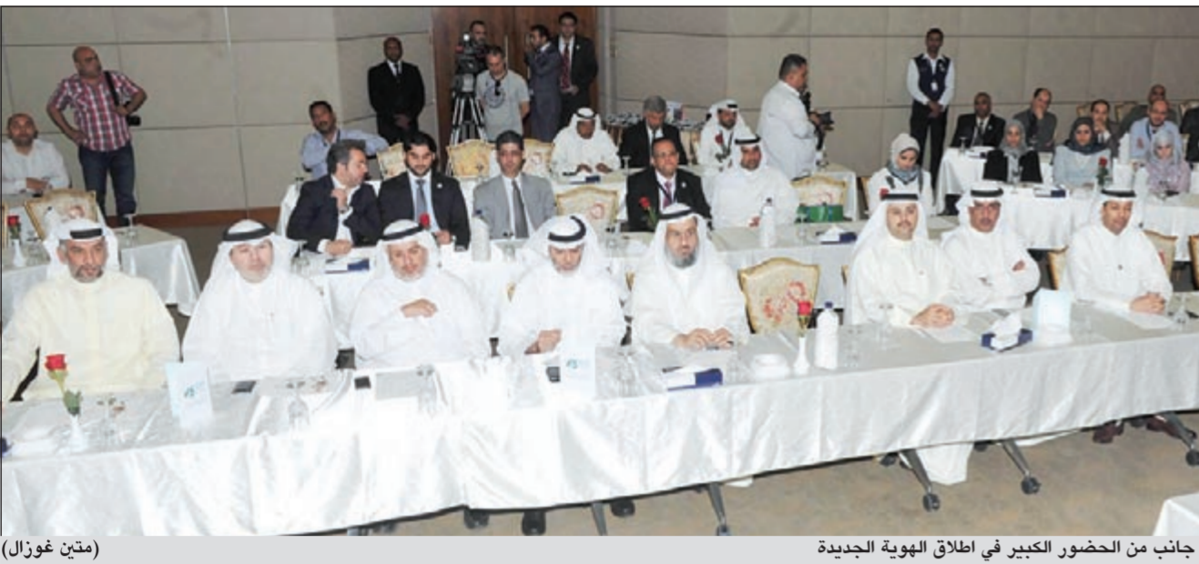
جانبا من الحضور الكبير في اطلاق الهوية الجديدة (متين غوزال)