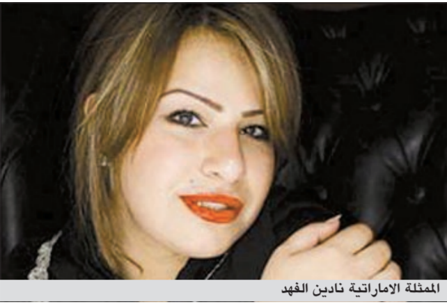
الممثلة الإماراتية نادين الفهد