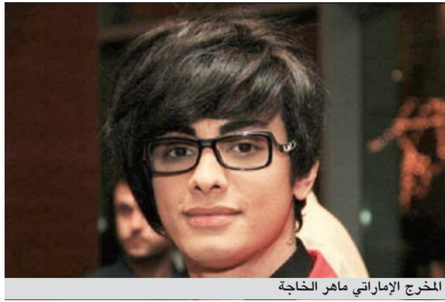
المخرج الإماراتي ماهر الخاجة

انتهى المخرج الإماراتي ماهر الخاجة من تصوير فيلمه الأجنبي القصير الذي يحمل اسم «We need to talk»، ويعد التجربة الثانية له بعد أن قدم في فترة سابقة فيلمه الأول «الجنة الضائعة» للكاتب البريطاني دان نيوتن ونال إعجاب المهتمين بالسينما في الوطن العربي. وأكد الخاجة لـ «الأخبار» من خلال اتصال تلفوني أن فيلمه الأجنبي الثاني مدته 35 دقيقة وهو فيلم رومانسي اجتماعي فكاهي وهو بعيد كل البعد عن سلسلة أفلام الرعب التي اشتهر بها وأثارت الجدل بين الجماهير الإماراتية لأنها كانت جريئة في فكرتها وتصويرها. ويخصوص أحداث فيلمه الجديد قال: «أحداث الفيلم تدور حول العلاقات العاطفية بين الرجل والمرأة في إطار فكاهي اجتماعي وهي مأخوذة من حياة بطلة الفيلم المذمعة البريطانية بونام فيرما مقدمة برنامج «أوت اند أبوات» الخاصة التي ستجسد شخصية صوفي التي