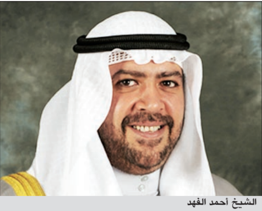
الشيخ أحمد الفهد

نظراً للدور البارز والفعال للشيخ أحمد الفهد في دعم الحركة الفنية والثقافية في الكويت، قام مجلس إدارة المسرح الشعبي بمنحه الرئاسة الفخرية.