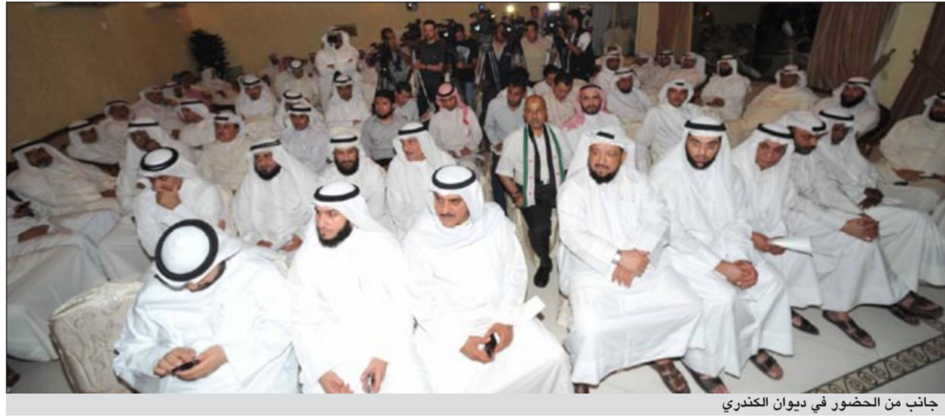
جانب من الحضور في ديوان الكندري

الكندري ان الكويت كانت من اكثر الدول الخليجية المتضررة من خلال استهدافها من قبل النظام البعثي للمقبور صدام حسين عام 1990. وأضاف ان الخطر الذي نعيشه الآن هو اكثر من الخطر الذي كان أثناء الاحتلال، مشيرا الى ان العراق وايران اليوم اصبحا كأنهما دولة واحدة يضمرون الشر والعدوان والتهديد للدول المجاورة. وبين ان الحكم الذي صدر بحق الخلية التجسسية منذ يومين هو اكبر ما نبئت عدوانية هذا النظام الإيراني ومن خلال