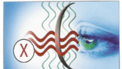
عدسات بدون بولورايز