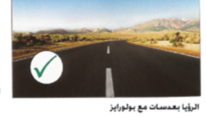
الرؤية بعدسات مع بولورايز