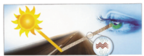
كيف تحجب نظارات البولورايز الإشعاعات؟