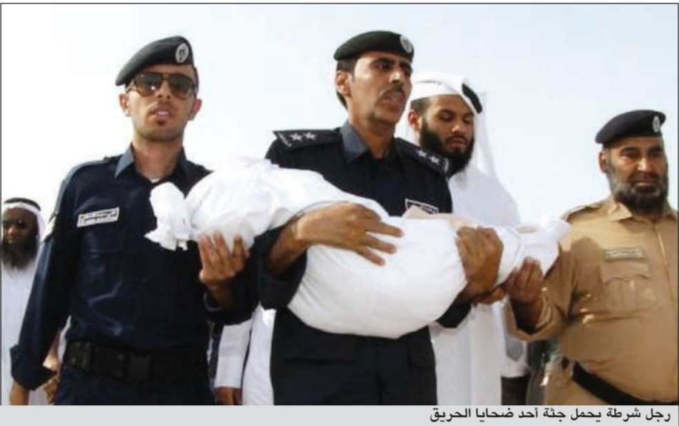
رجل شرطة يحمل جثة أحد ضحايا الحريق

من المستشفى دون ان توضح ما اذا كان بينهم اطفال. ونقلت صحيفة الراهية عن مصدر في وزارة الشؤون الاجتماعية تأكيد «عدم منح الوزارة اي ترخيص لتشغيل حضانة او روضة اطفال بمجمع فيلاجيو».