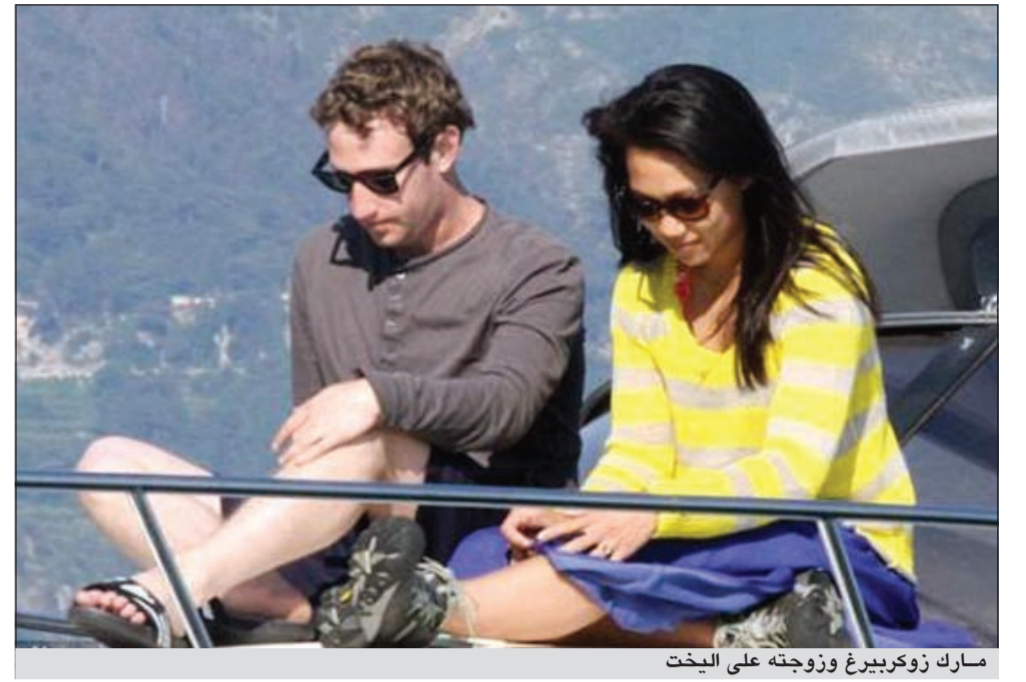
مارك زوكربيرغ وزوجته على اليخت

في ابطاليا. وقد تزوج الشريكان في بالو آلتو بكاليفورنيا في 19 مايو الحالي. وجاء الزواج مفاجأة لـ 100 صيف قيل لهم انهم اجتمعوا للاحتفال بتخرج شان من الجامعة في كاليفورنيا.