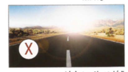
الرؤية بعدسات بدون بولورايز